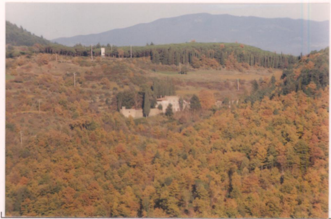
p.v. N. 1 Fattoria La Speranza da Colignola...