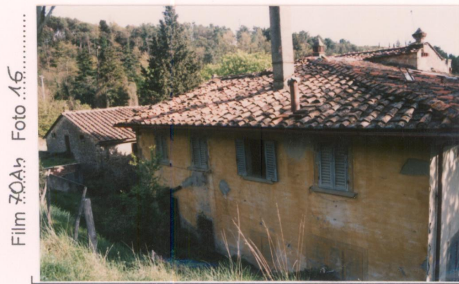
Film 30A4 Foto 16