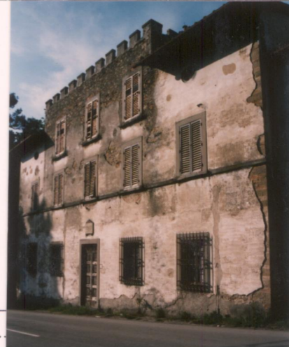
p.v. N. 4