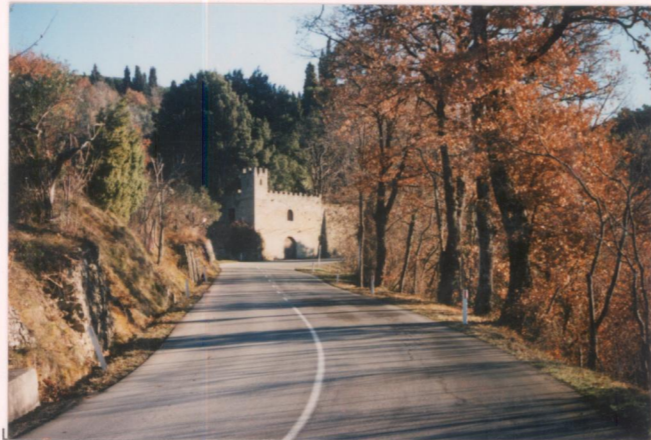
p.v. N. 2