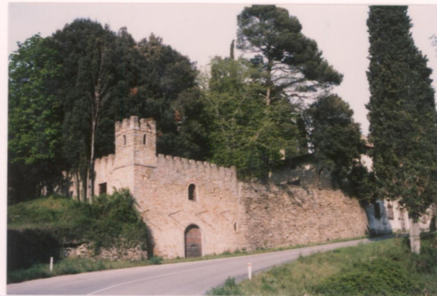
p.v. N. 3 vista della Libbia