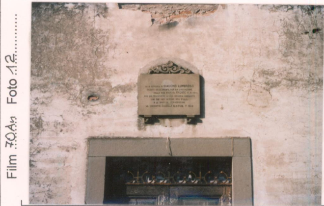
Film 30A4 Foto 12