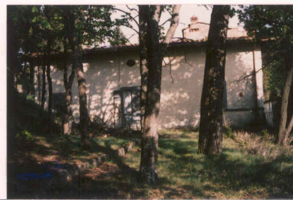
Film 30A4 Foto 17