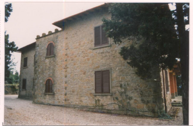
Film 40A 4 Foto 24