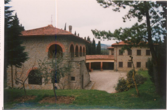
Film 40Aa Foto 25