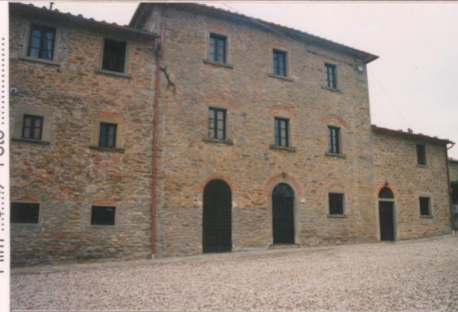
Film 40A 4 Foto 33