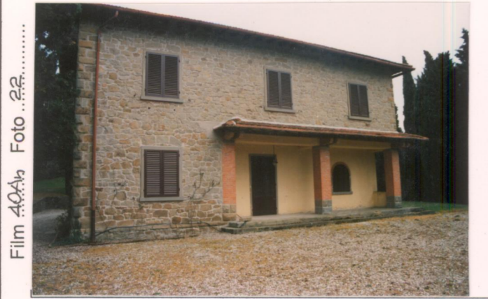
Film 40A 4 Foto 22