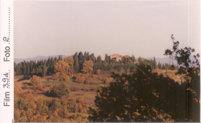
Film 39A. Foto 25