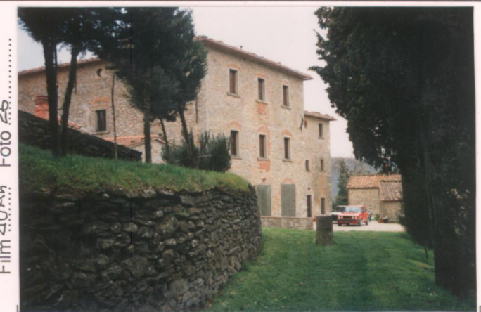
Film 40A 4 Foto 26