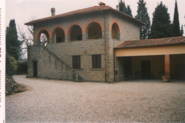
Film 40Aa Foto 2A