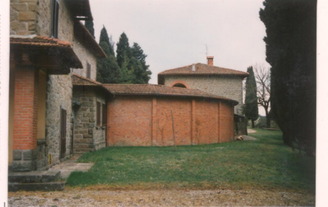
Film 40Aa Foto 23