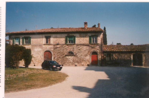
p.v. N. 8 La casa del custode con a piano terra le ex scuderie