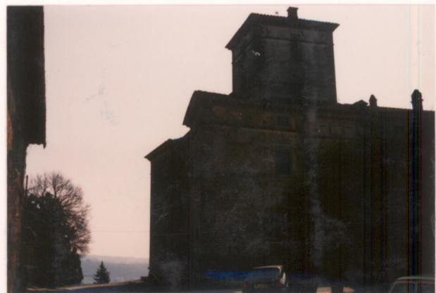
p.v. N. 5