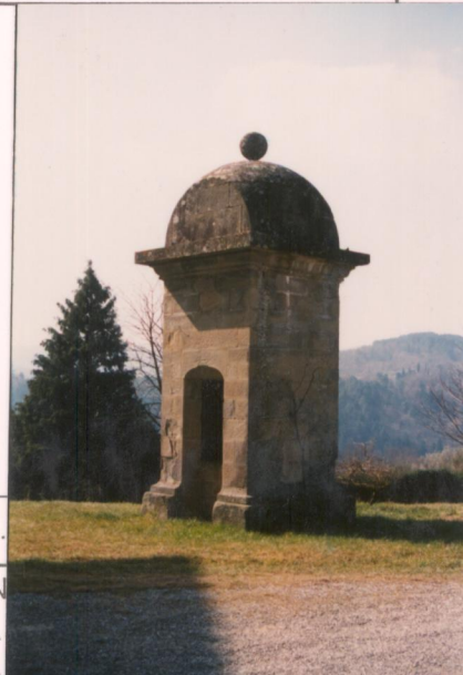
p.v. N. 7