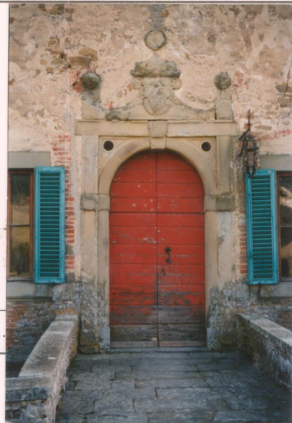
p.v. N. 6