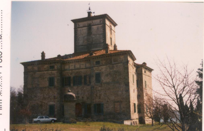
p.v. N. 4. Fronte nord-ovest.....