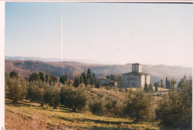
p.v. N. 2. Vista dalla strada per il cenacolo di Montauto.....