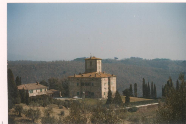
p.v. N. 3. Talamone.....