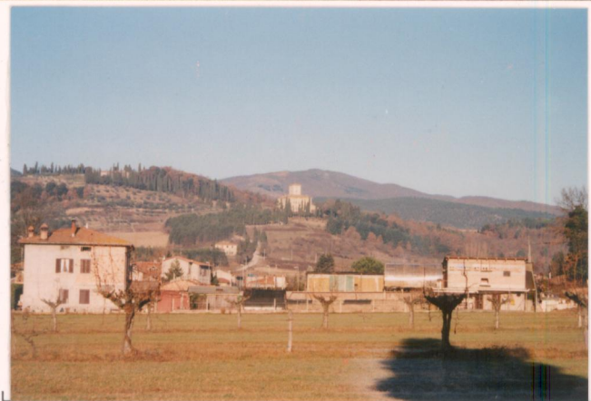
p.v. N. 1. Vista dalla Libia.....