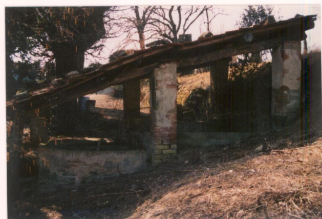
Film 24An Foto 18 Il lavatoio