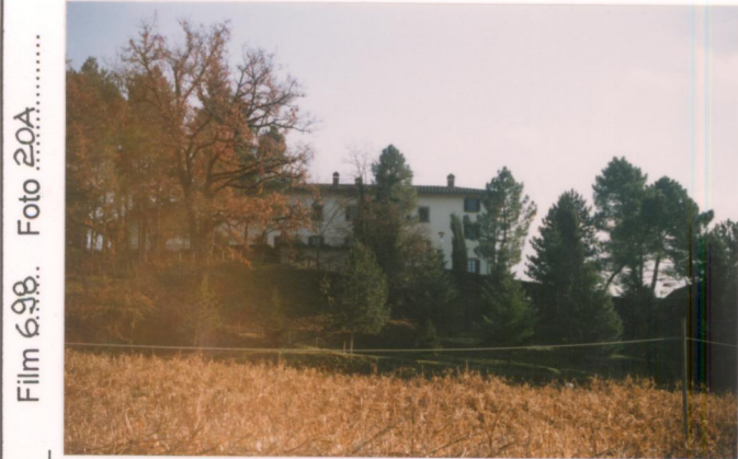
p.v. N.1 Dalla strada Senese Aretna