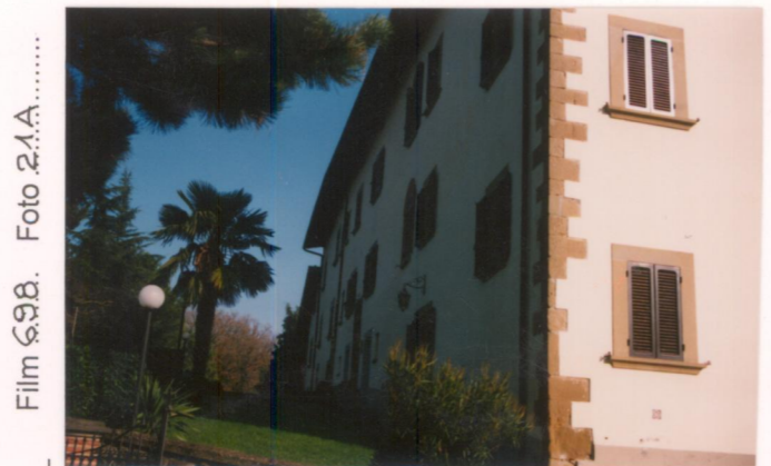
p.v. N.2 Fronte nord-ovest