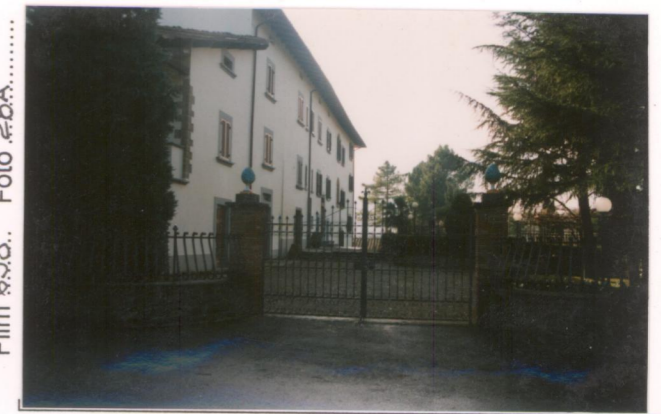
Film 698. Foto 28A