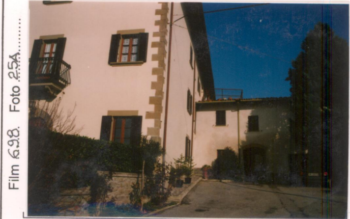
Film 698. Foto 25A