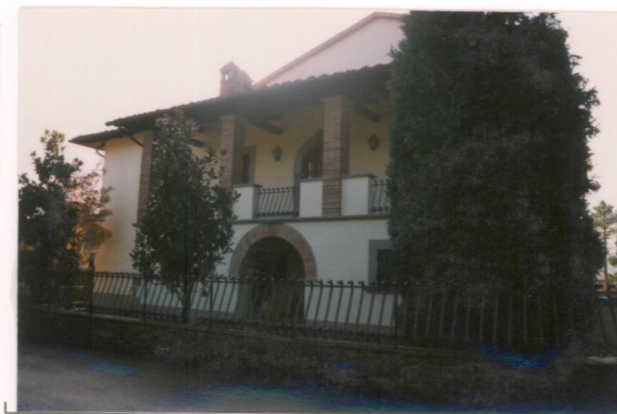
Film 698. Foto 27A