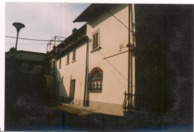
Film 698. Foto 26A