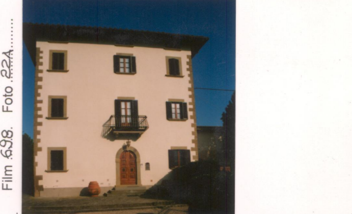
p.v. N.4 Fronte sud-ovest