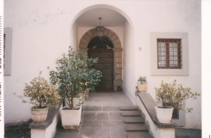
p.v. N. 4