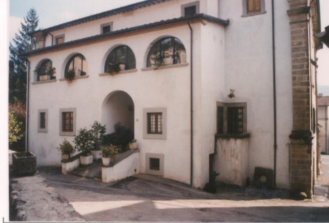
p.v. N. 3. Il fronte nord-ovest