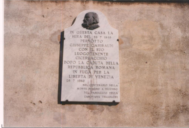
p.v. N. 2. Iscrizione sul fronte sud-ovest