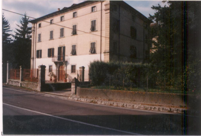
p.v. N. 1. Vista dalla strada Senese - Aretina.