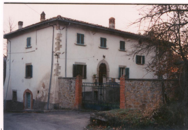
p.v. N3 Casa padronale n. 1: fronti este nord