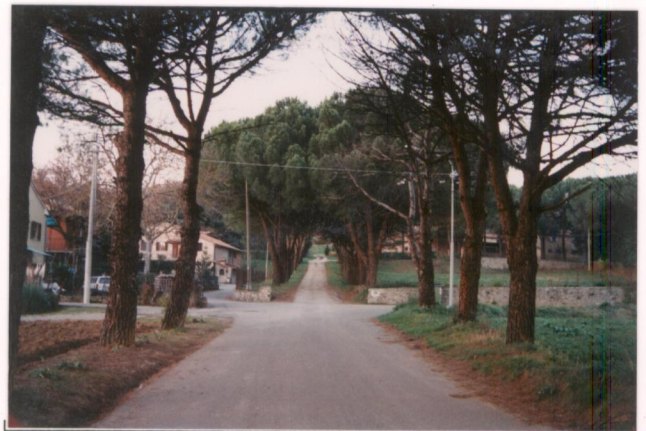
p.v. N. 1