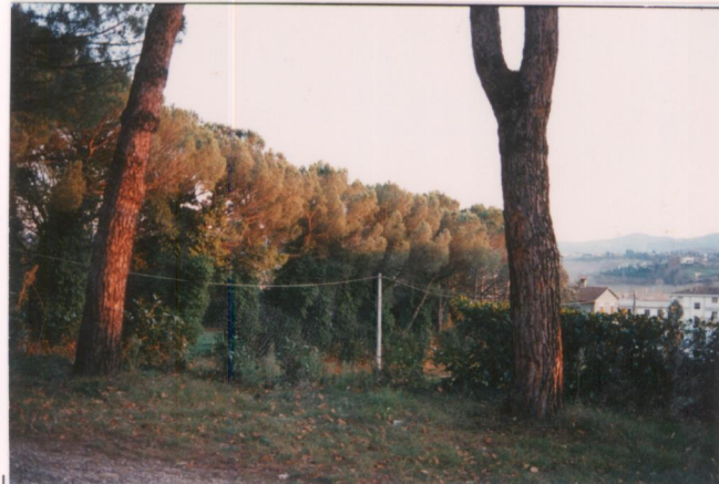
p.v. N. 2