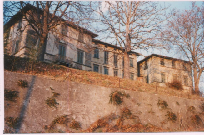
Film 696 Foto 12