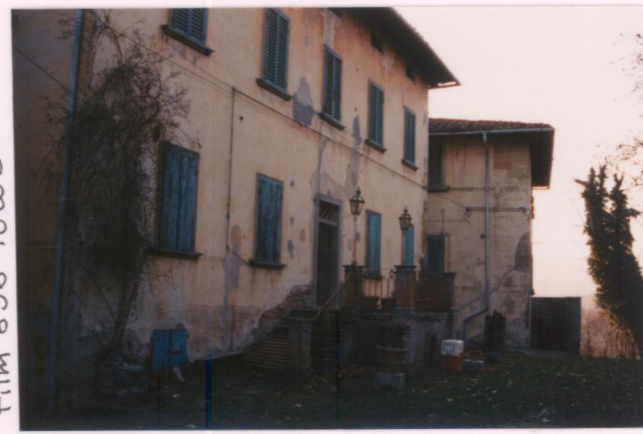
Film 696 Foto 5