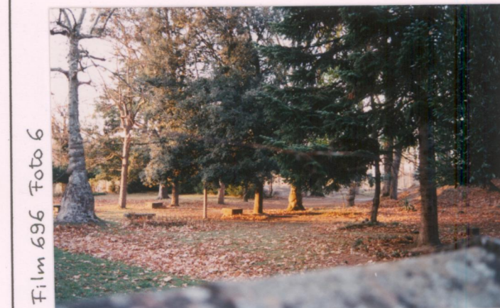
Film 696 Foto 6