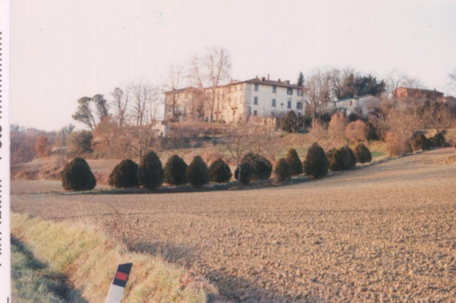
Film 69.6. Foto 2.