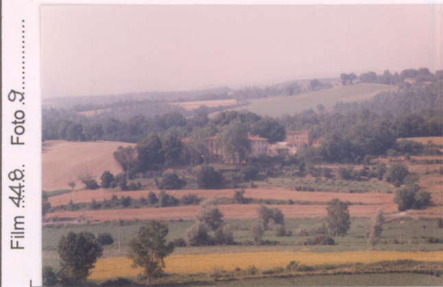
Film 44.8. Foto 9.