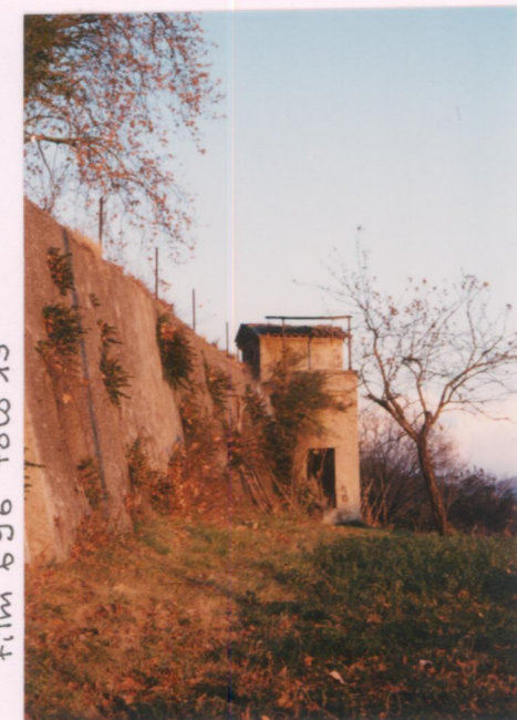
Film 696 Foto 13