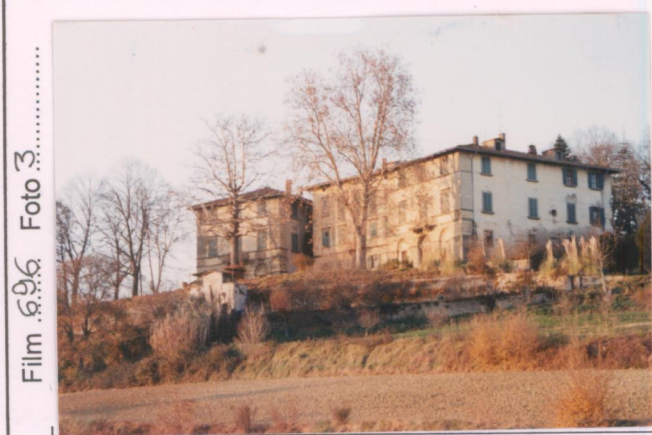
Film 696 Foto 3