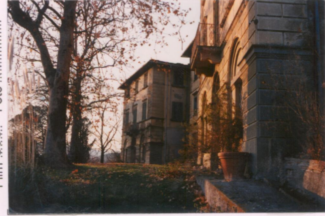
Film 696 Foto 10