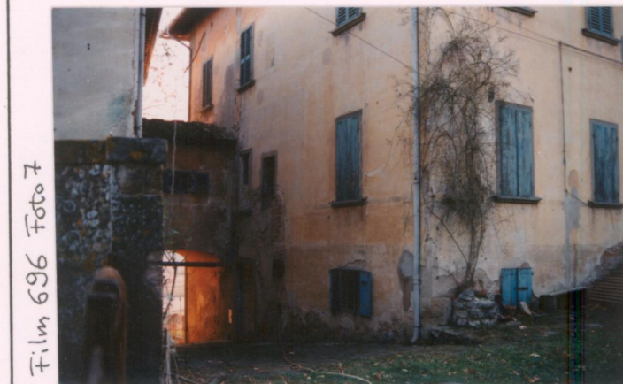
Film 696 Foto 7