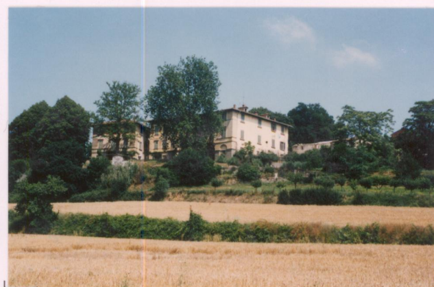
Film 44.2. Foto 34.