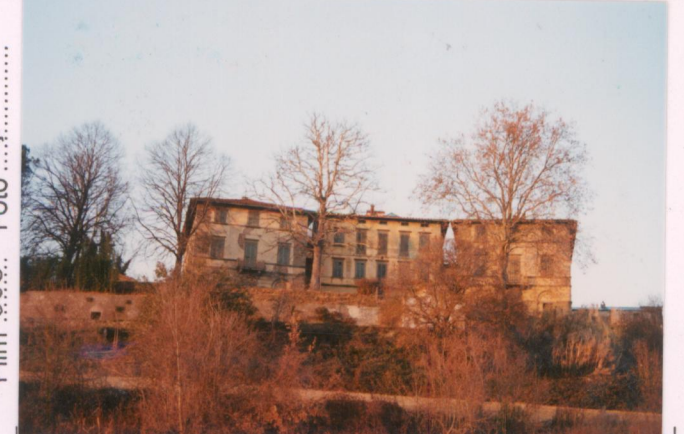
Film 69.6. Foto 14.