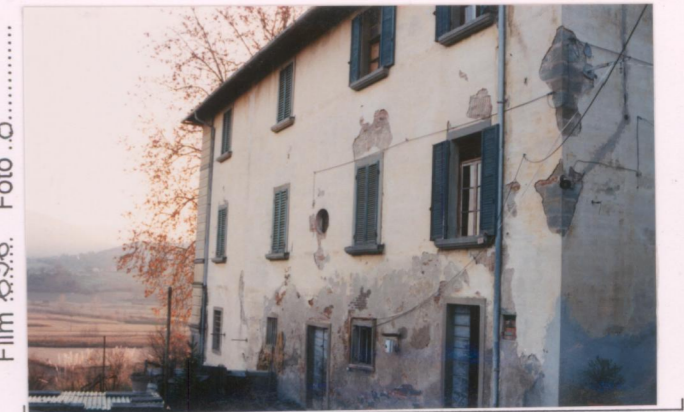
Film 696 Foto 8