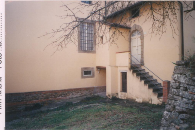
Film 686 Foto 8