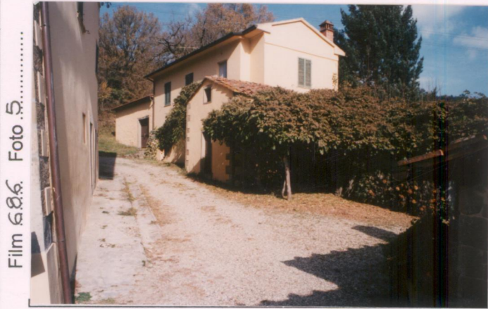
Film 686 Foto 5