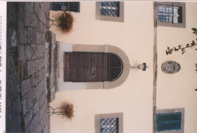
Film 686: Foto 6..... p.v. N. 4.....