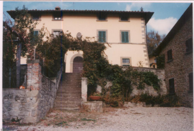
Film 686: Foto 1..... p.v. N. 2.....