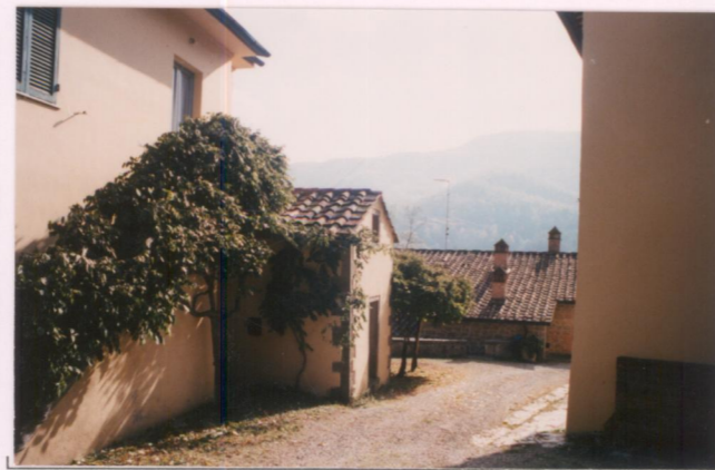
Film 686 Foto 7