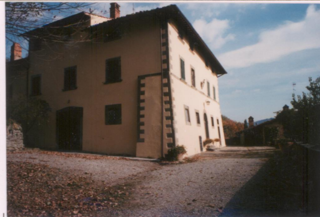
Film 686: Foto 3..... p.v. N. 3.....