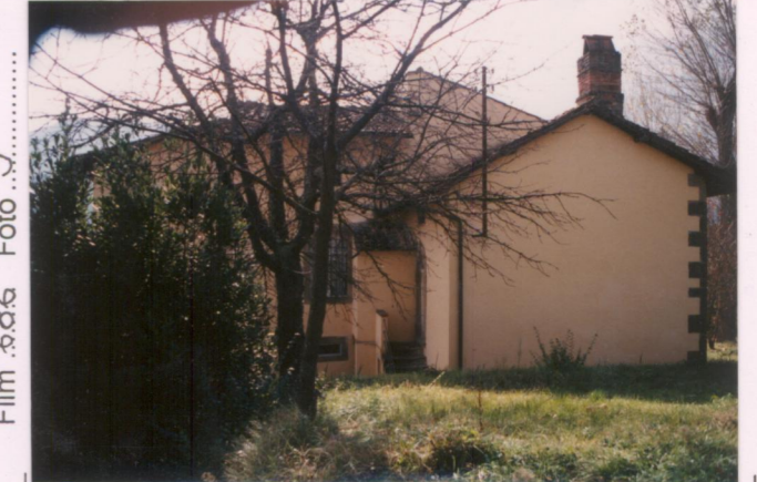
Film 686 Foto 9