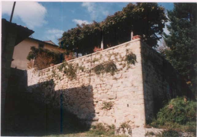
Film 686 Foto 10