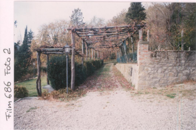
Film 686 Foto 2