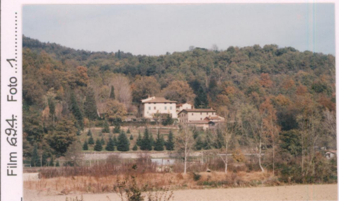
Film 684: Foto 1..... p.v. N. 1... Vista da Ranco.....