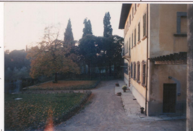
Film 665.85 Foto 4.A