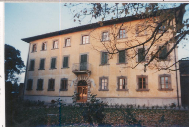
Film 665.85 Foto 3.A