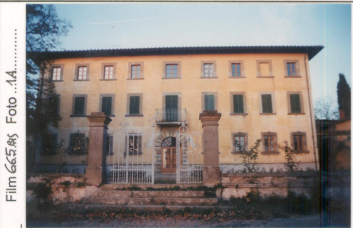
Film 665.85 Foto 1.A