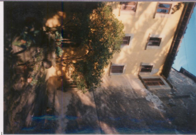
p.v. N. 2