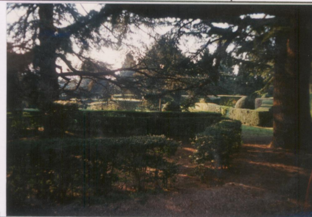
p.v. N. 7 .....