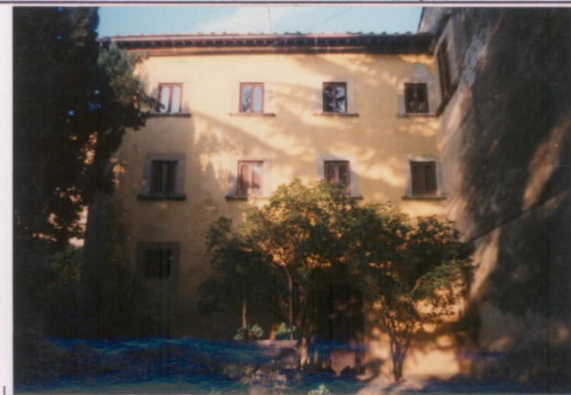
p.v. N. 3