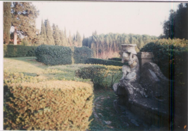
p.v. N. 5 : giardino formale.....