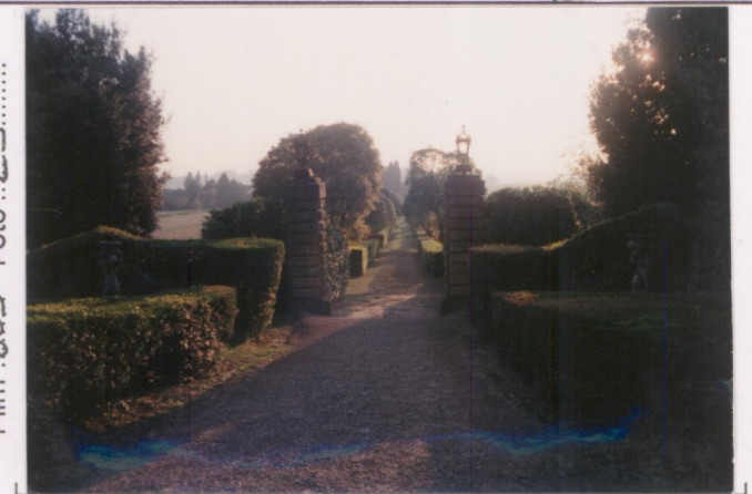
p.v. N. 4 : viale (contracampo)