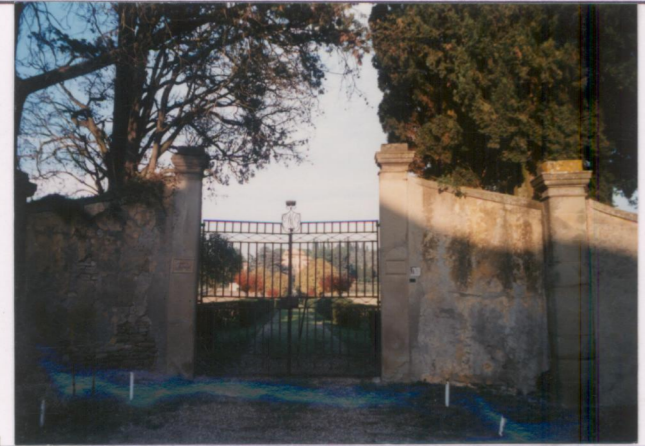
p.v. N. 1 : viale d'ingresso