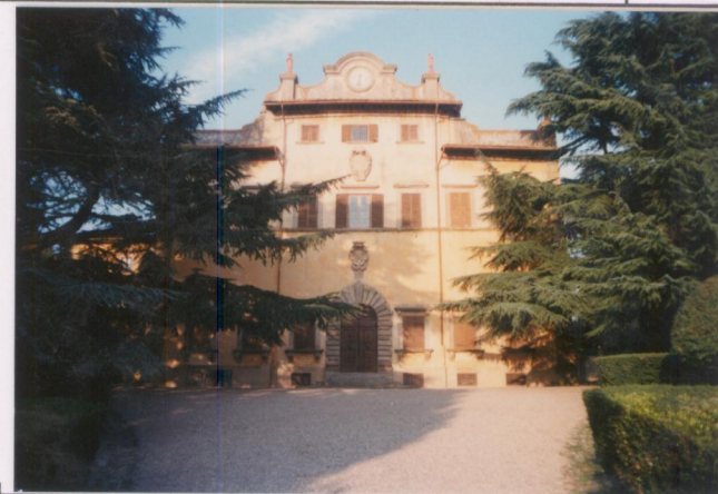
p.v. N. 6 .....