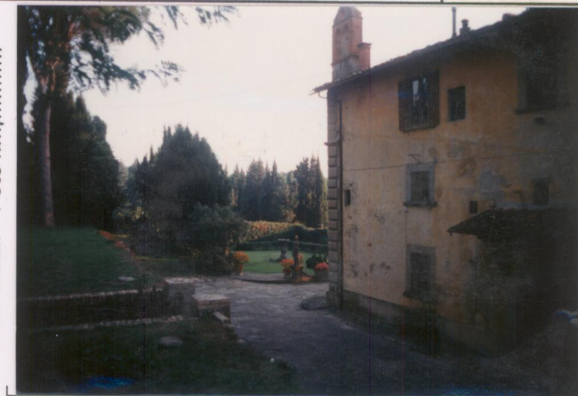
p.v. N. 8 : giardino sul retro.....