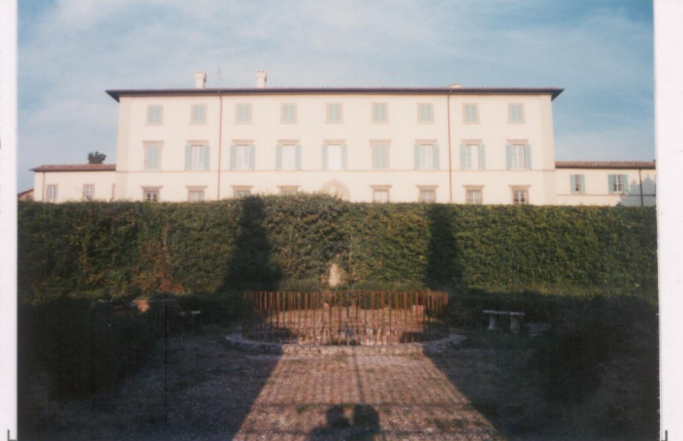
Film .663. Foto .19.....