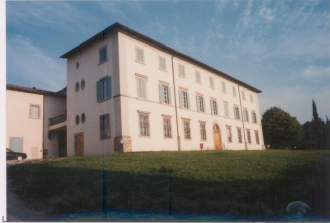
Film .663. Foto .17.....