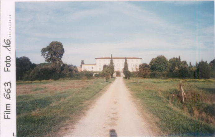
Film .663. Foto .16.....