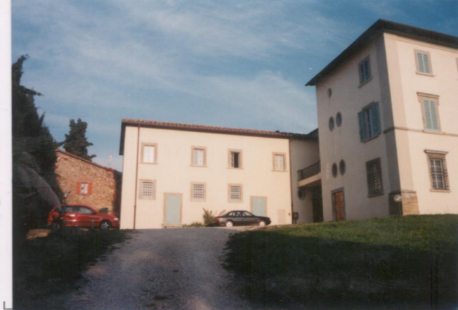
Film .663. Foto .18.....