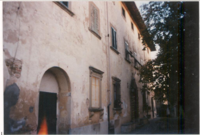
p.v. N. 1