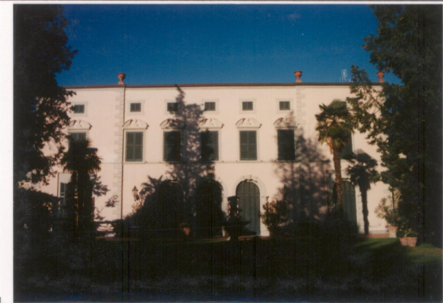
Film 664. Foto 15..... p.v. N. 3.....