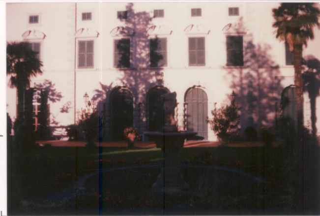
Film 664. Foto 16..... p.v. N. 2.....