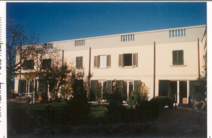
Film 664. Foto 14..... p.v. N. 4: "ala" ristrutturata a residenza.....