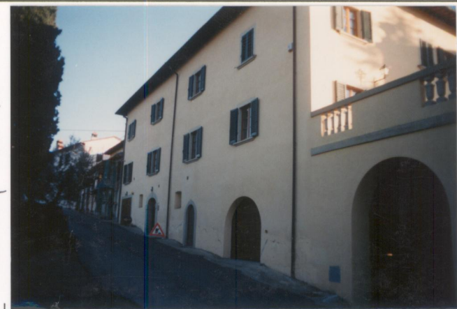
p.v. N. 6: idem