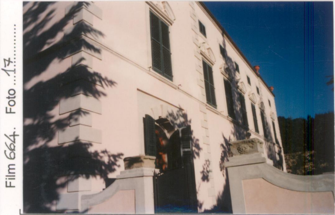
Film 664. Foto 17..... p.v. N. 1.....