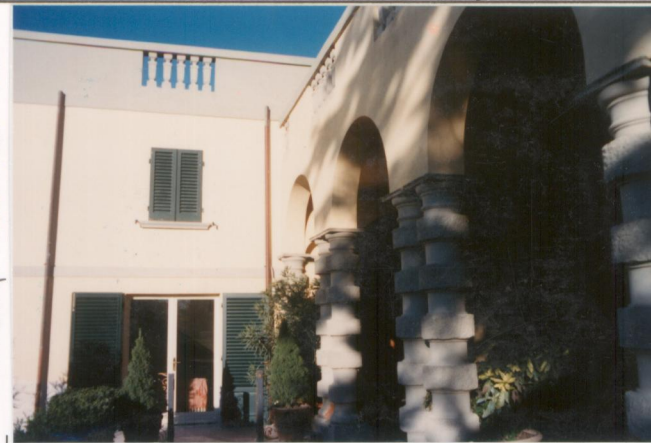
p.v. N. 7