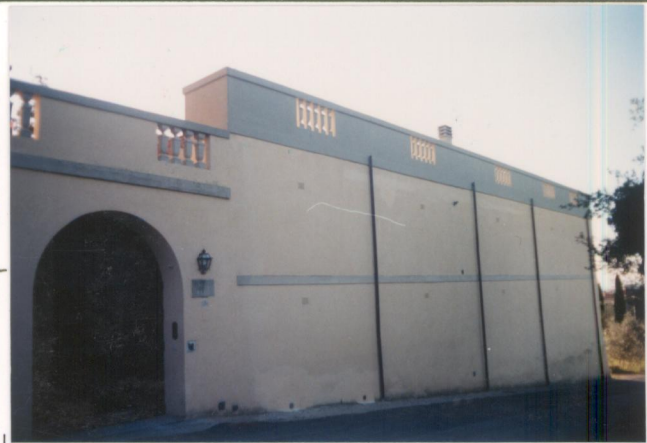
p.v. N. 5: lungo la strada