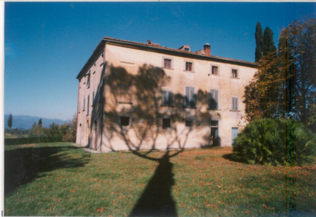
p.v. N. 1