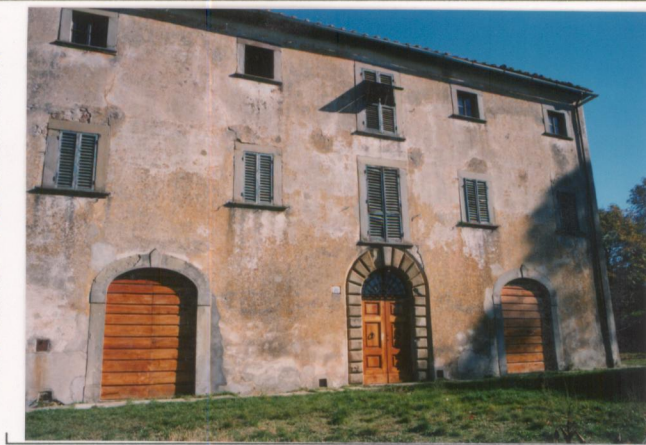
p.v. N. 2. Fronte principale