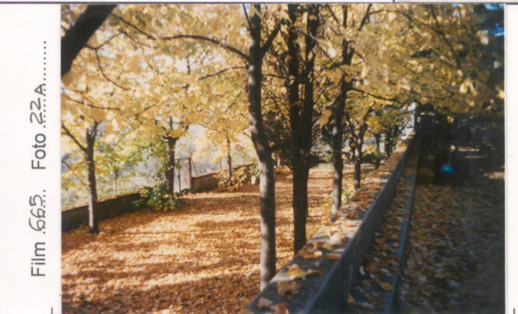
Film .665. Foto 2.2.A..... p.v. N. 4.....