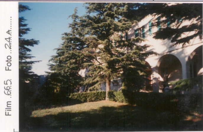
Film .665. Foto 2.4.A..... p.v. N. 3.....