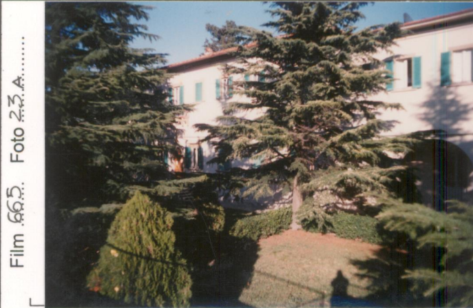
Film .665. Foto 2.3.A..... p.v. N. 1. Il fronte principale con i cedri del giardino antistante la villa