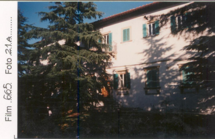
Film .665. Foto 2.1.A..... p.v. N. 2.....