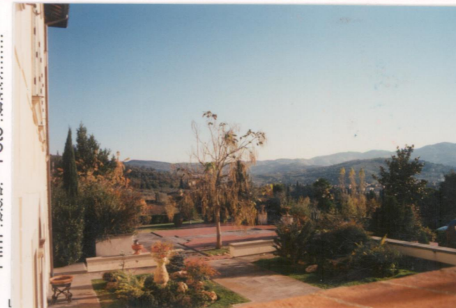
Film .665. Foto 28A.....