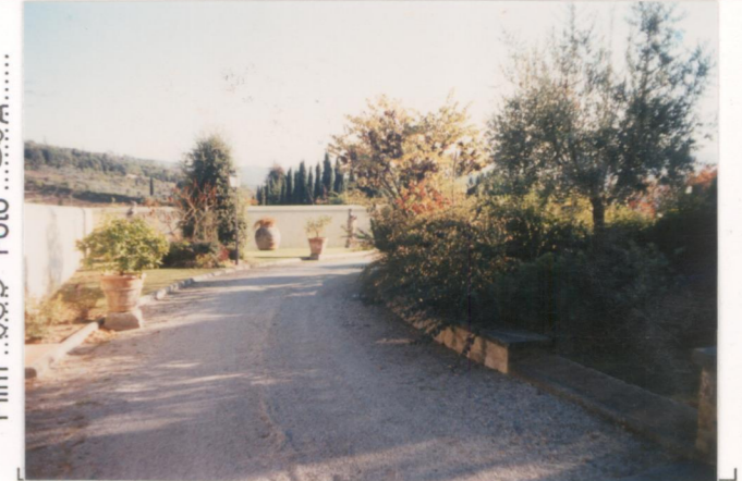
Film .665. Foto 26A.....