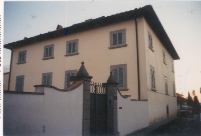
Film .665. Foto 26A.....