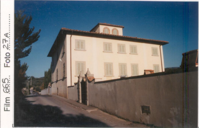
Film .665. Foto 27A.....