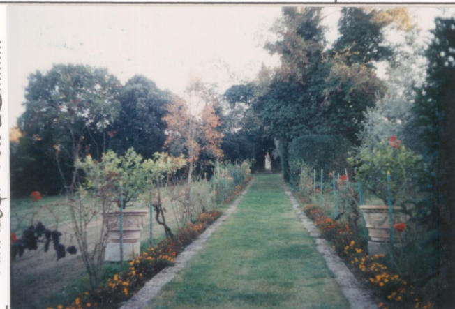
Film 664. Foto 32