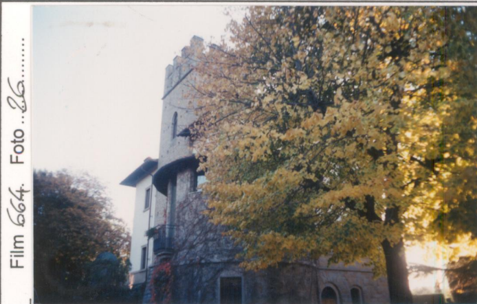
Film 664. Foto 26