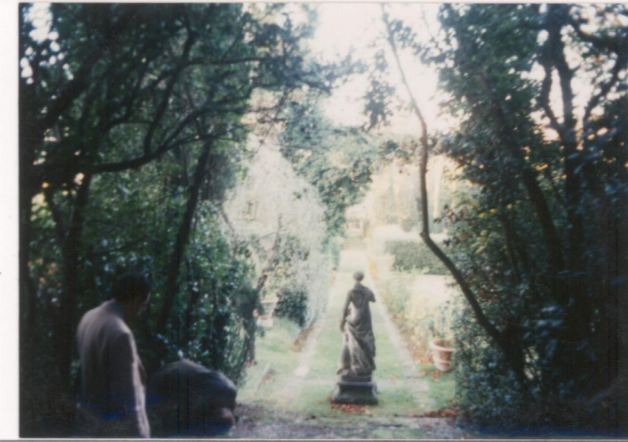
Film 664. Foto 31.....