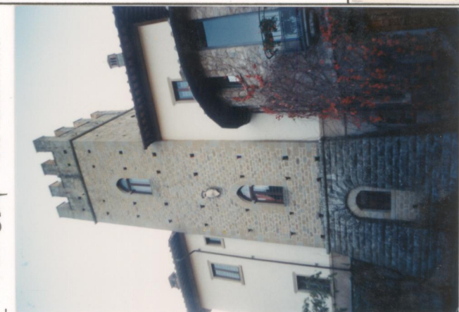
Film 664. Foto 25