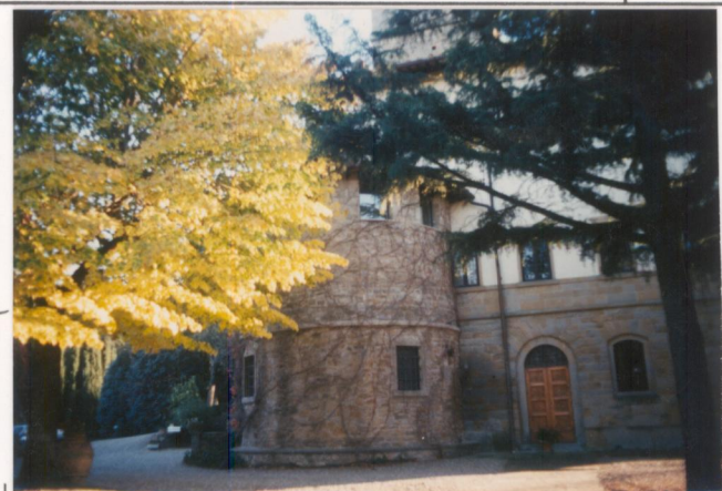
Film 664. Foto 27