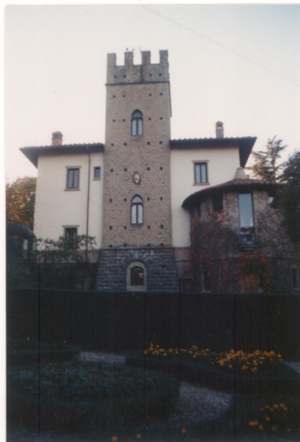
P.V. N° 10 Film: 664 Foto: 34