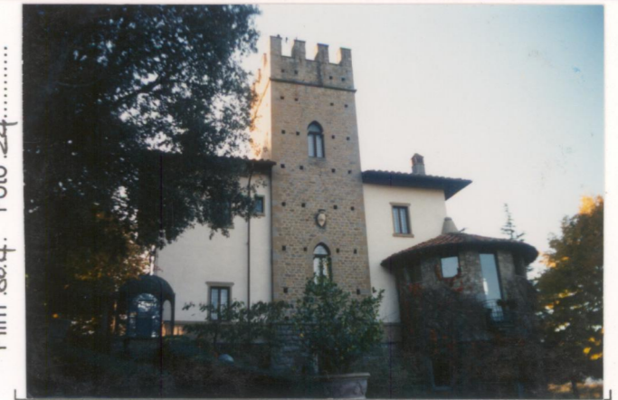
Film 664. Foto 24.....