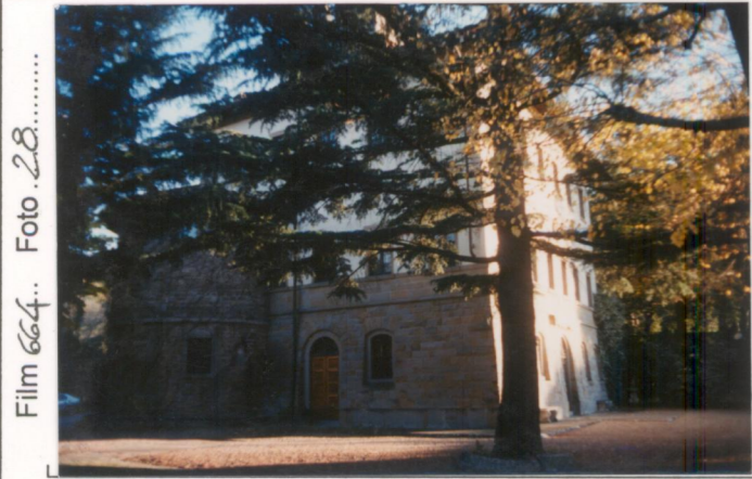
Film 664. Foto 28.....