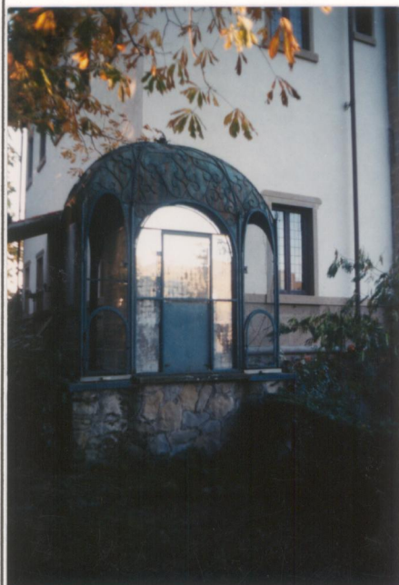
P.V. N° 9 Film: 664 Foto: 33