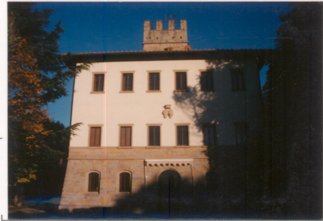
Film 664. Foto 25.....