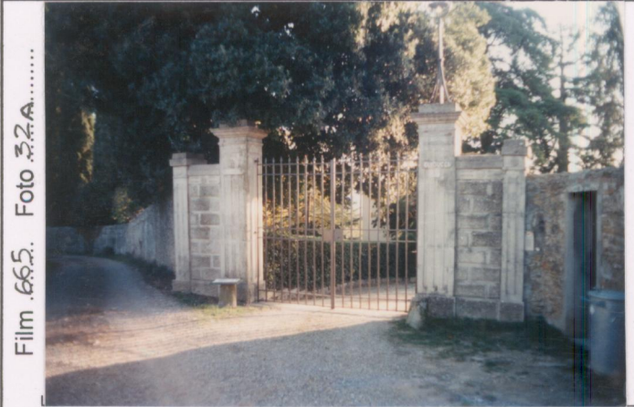
Film 665. Foto 32A.....