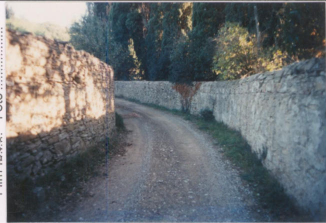
Film 665. Foto 33A.....