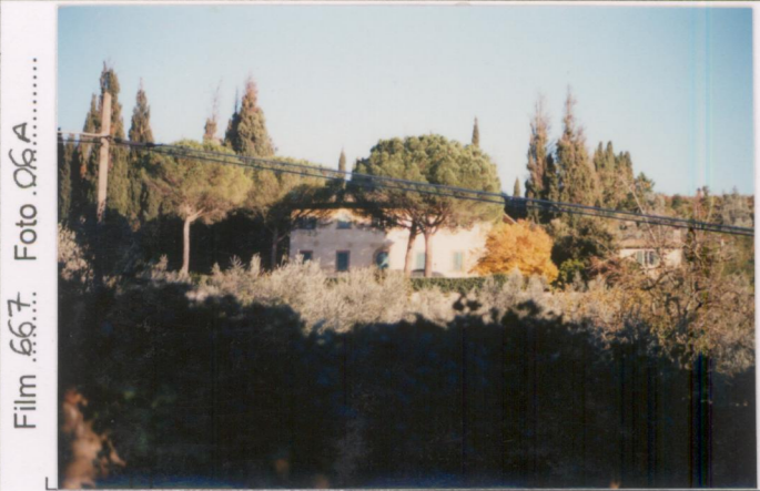
Film 66.7. Foto 06.A.....