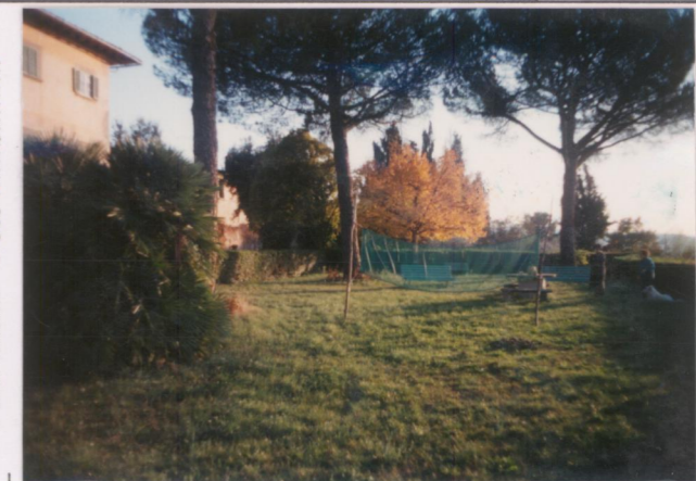
Film 66.5. Foto 35.A.....