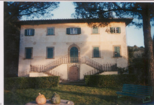
Film 66.5. Foto 34.A.....