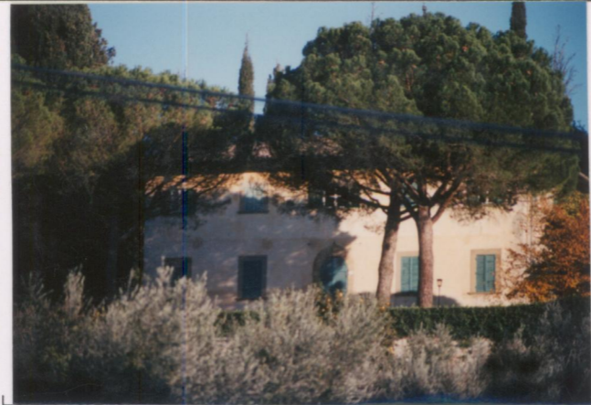
Film 66.7. Foto 05.A.....