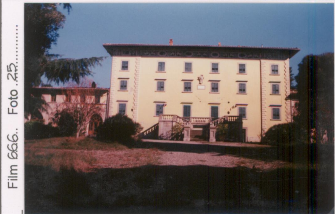
Film 666. Foto 25.....