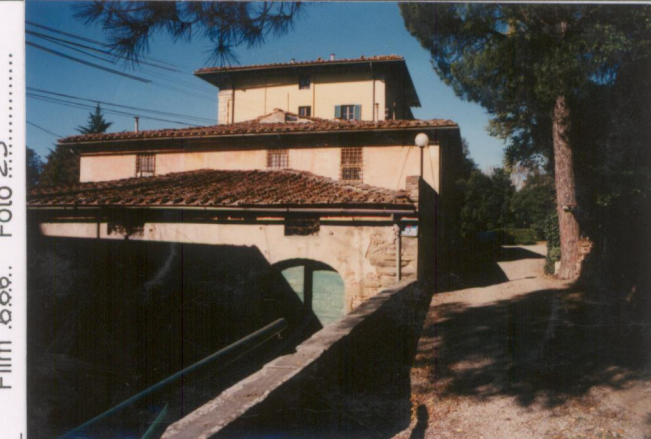
Film 666. Foto 23.....