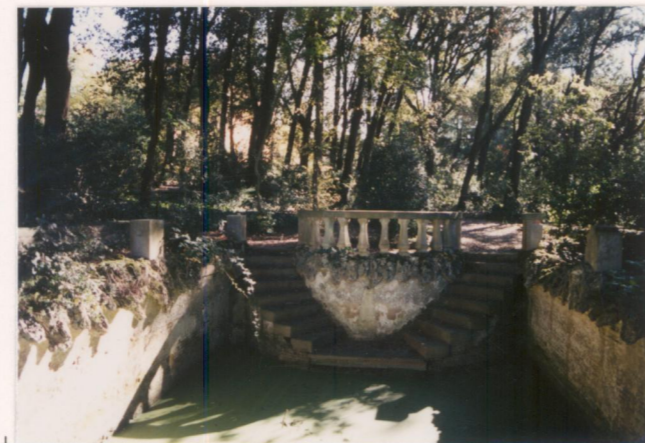
p.v. N. 14..... La vasca d'acqua con la scala... semicircolare