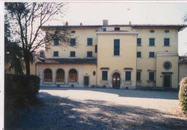
Film 667. Foto 01.....