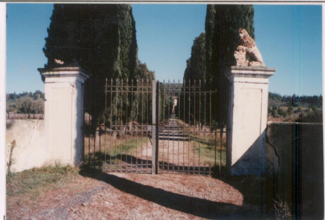
p.v. N. 1. Il viale d'ingresso alberato.