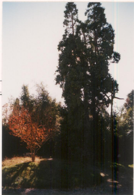
p.v. N. 13.....