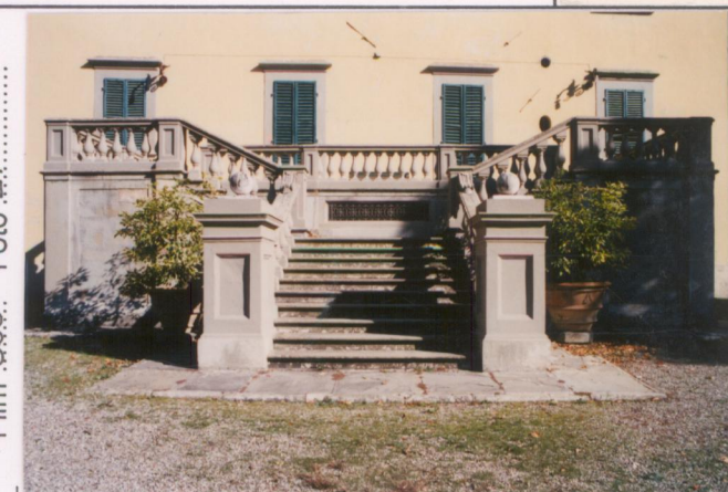
p.v. N. 4. Particolare della scala monumentale.