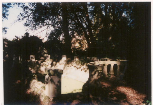
p.v. N. 15..... Idem (controcampo)