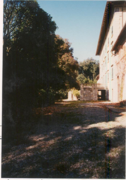
p.v. N. 9.....