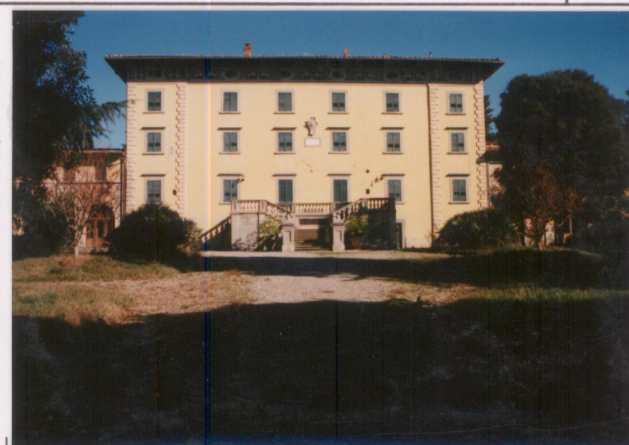
p.v. N. 2. Prospetto principale della villa.