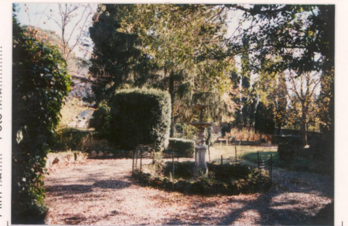
p.v. N. 12..... Idem