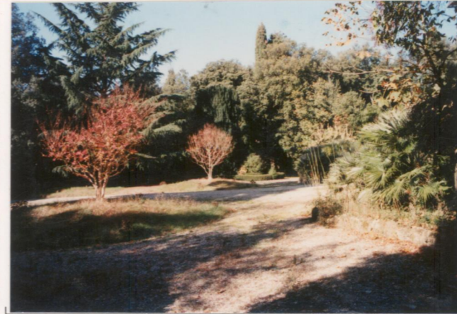
p.v. N. 11..... Il giardino formale