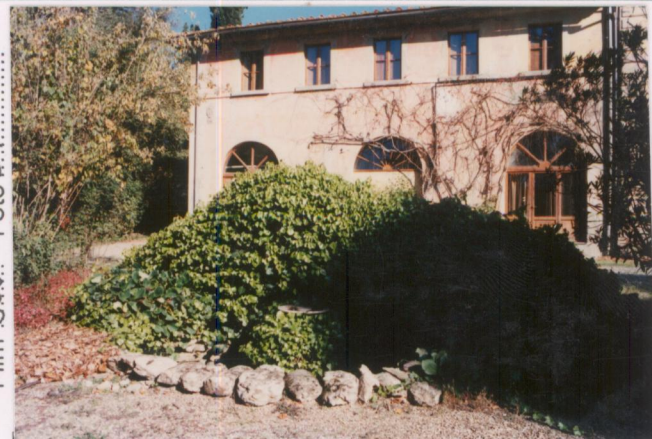
Film 666. Foto 31.....