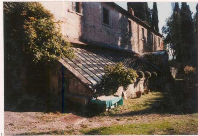
p.v. N. 10..... La serra