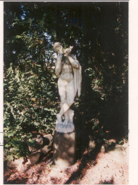
p.v. N. 16.....