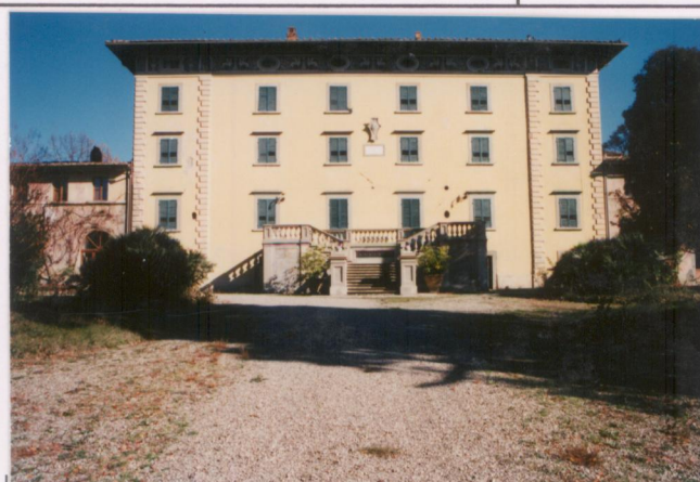
p.v. N. 3. Idem.