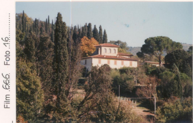
Film .666 Foto .16.....