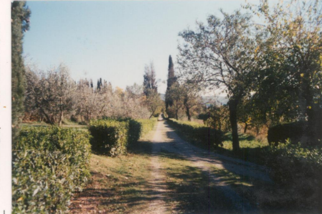
Film .664 Foto .06.....