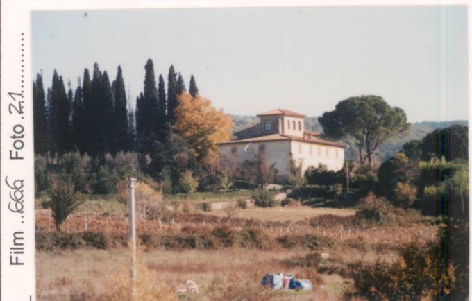
Film .666 Foto .21.....