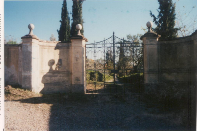
Film .664 Foto .07.....