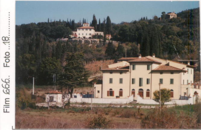
p.v. N. 1...Villa Severi e (sopra) villa Ada...