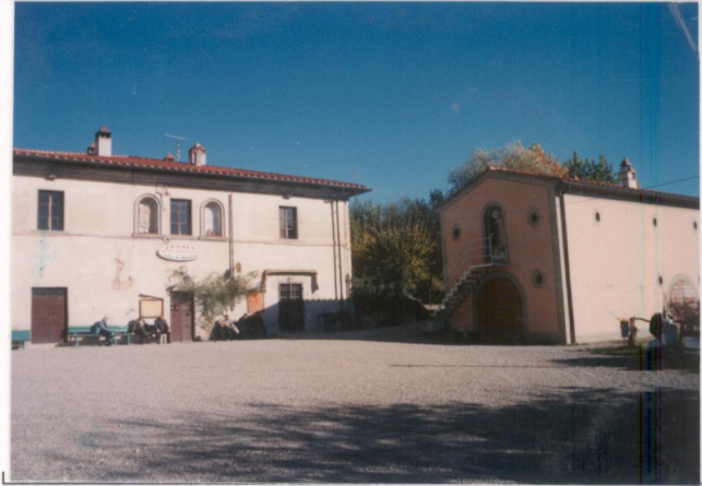
p.v. N. 5 Gli annessi