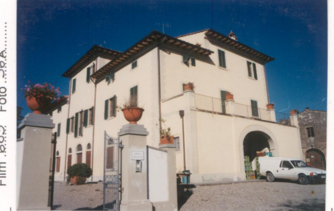
p.v. N. 4...veduta d'angolo.....