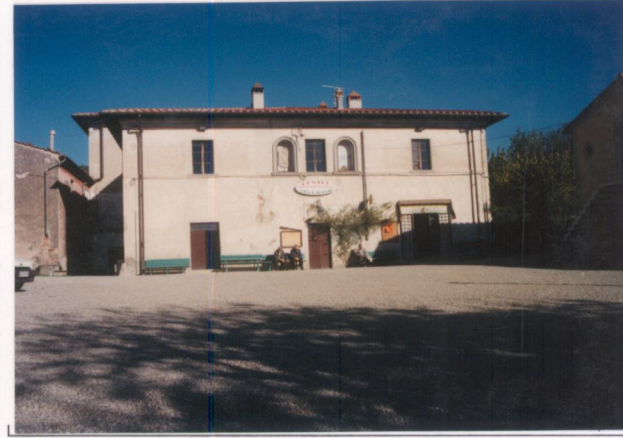
p.v. N. 6 Idem