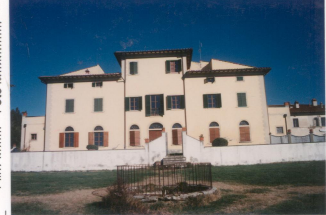
p.v. N. 3...Il fronte principale dal giardino.