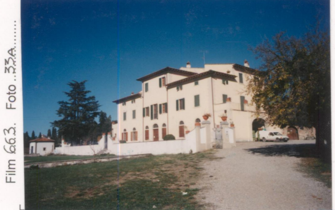
p.v. N. 2...veduta dalla strada di accesso.....