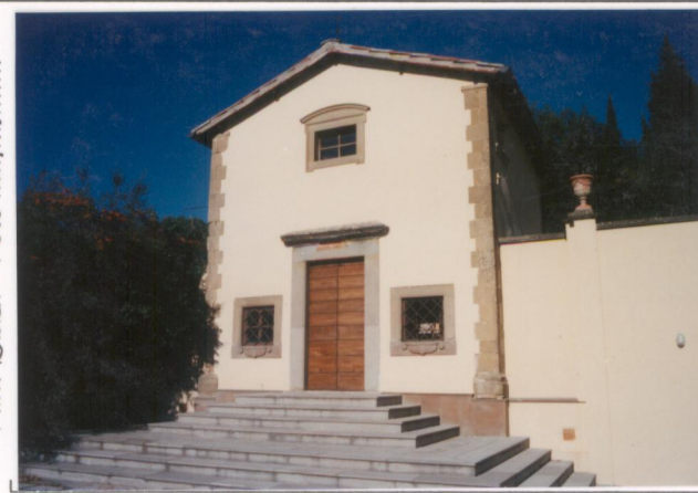
p.v. N. 7.....