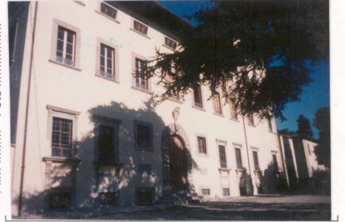
p.v. N.4...Il prospetto principale.....