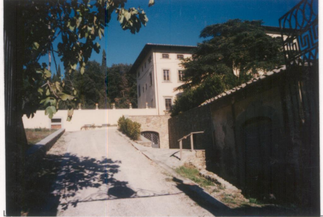
p.v. N.2...La strada di accesso.....