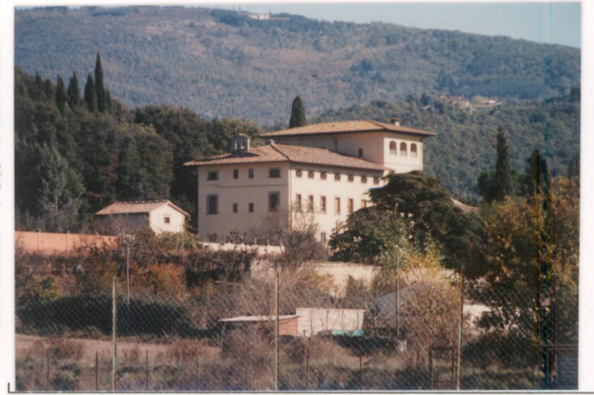
p.v. N.1...veduta panoramica.....