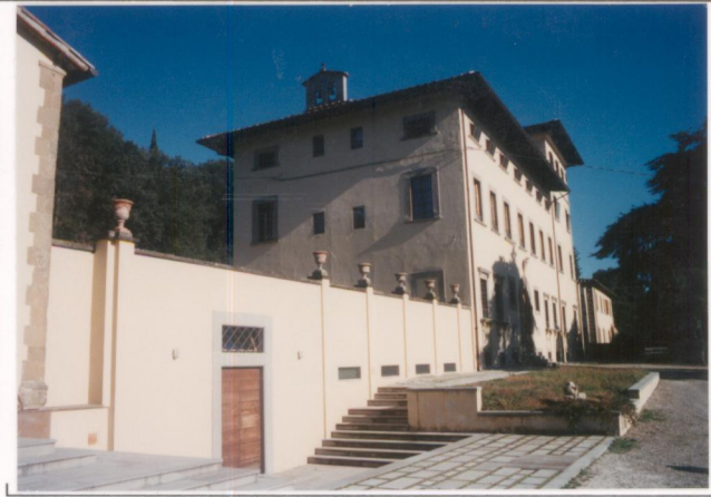
p.v. N. 6.....