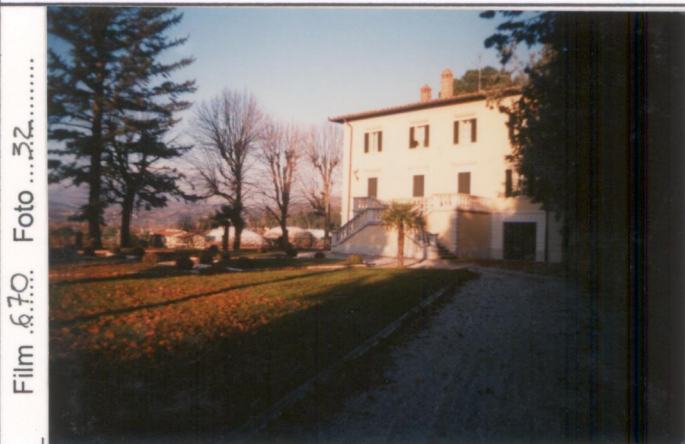
Film 6.70. Foto 32.....