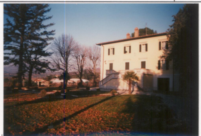
Film 6.70. Foto 32.....