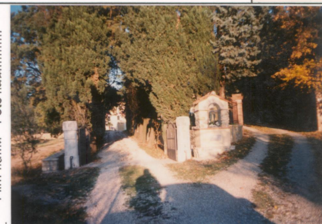
Film 6.70. Foto 35.....