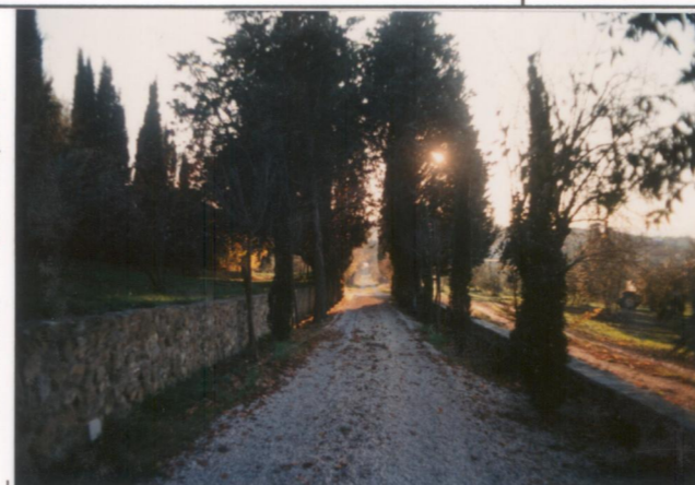
Film 6.70. Foto 34.....