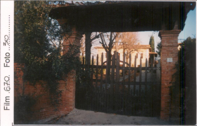
Film 670. Foto 30. p.v. N. 1.