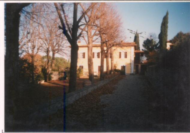
Film 670. Foto 29. p.v. N. 2.