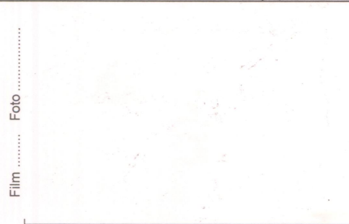
Film ..... Foto ..... p.v. N. ....