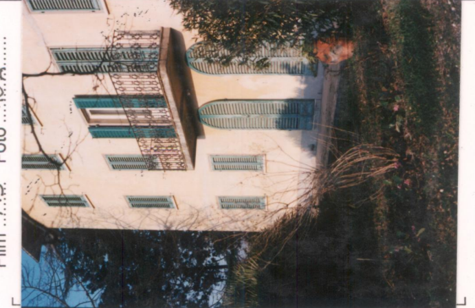
p.v. N. 4 Particolare della facciata.....