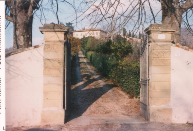
p.v. N. 3 L'ingresso della villa.....