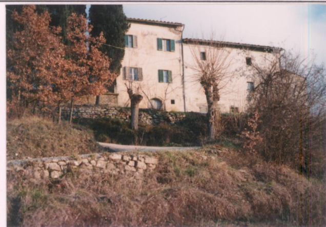
p.v. N. 1..... Fronte principale della villa.....