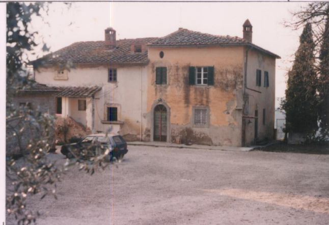
p.v. N. 2..... Prospetto retrostante.....