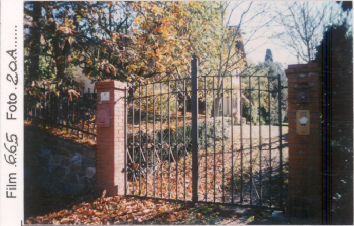
Film 665 Foto 20A.....