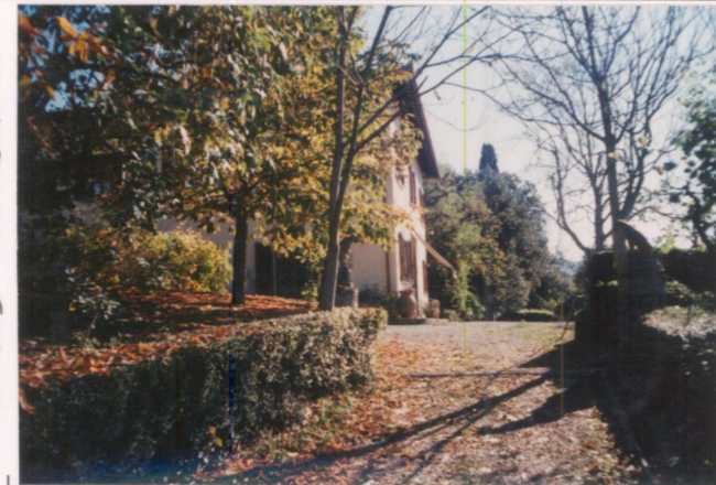
Film 665 Foto 19A.....