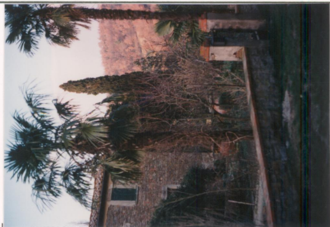
p.v. N. .5.....Scorcio del giardino.....