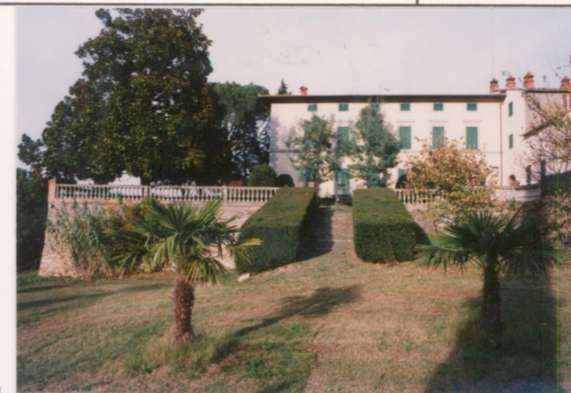
Film 669.. Foto 36..... p.v. N. 3...Retro...il giardino formale.....