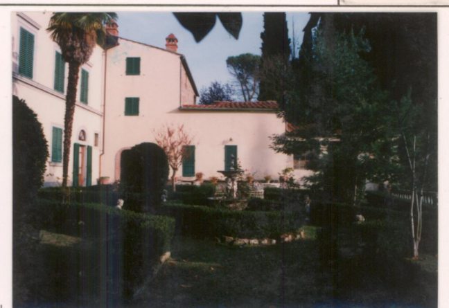
Film 669.. Foto 36..... p.v. N. 4...veduta della limonaia dal giardino.....