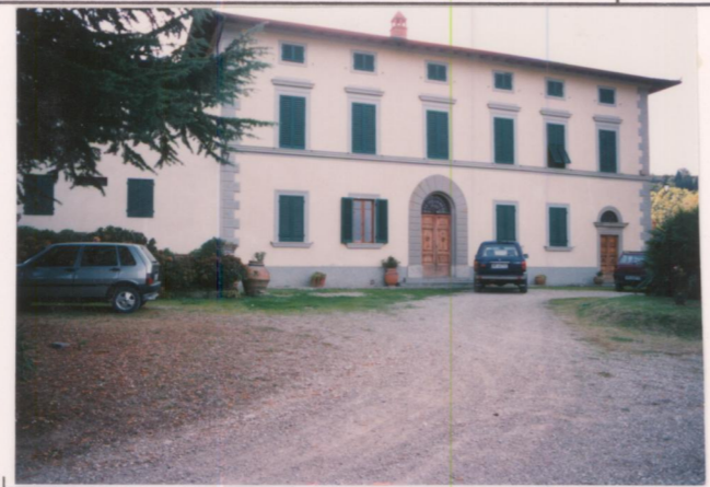
Film 669.. Foto 35..... p.v. N. 2...Fronte principale.....