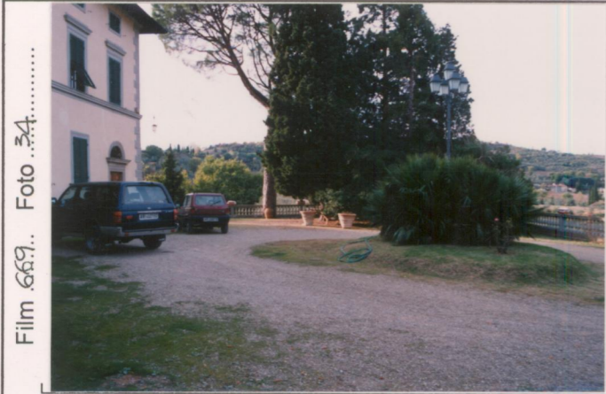
Film 669.. Foto 34..... p.v. N. 1.....