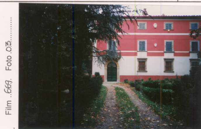
Film .669. Foto Q3. .... p.v. N. 2. Fronte principale