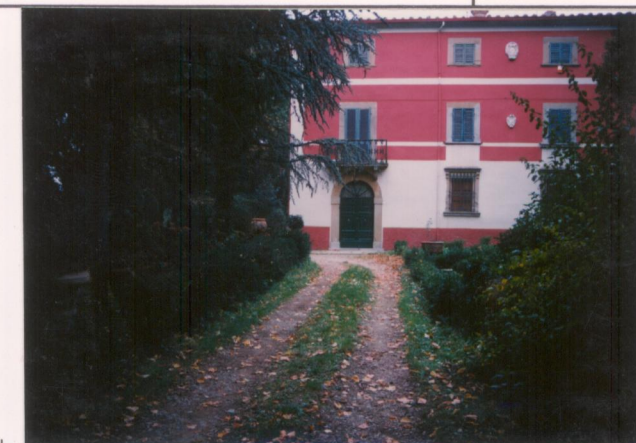
Film .669. Foto Q6. .... p.v. N. 3