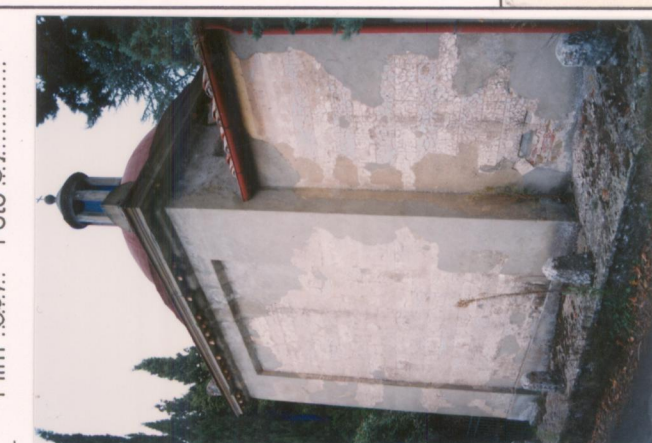
Film .669. Foto Q7. .... p.v. N. 4. La piccola cappella