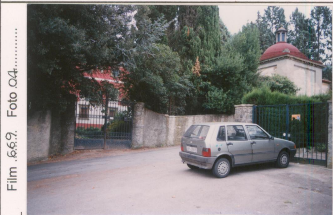
Film .669. Foto Q4. .... p.v. N. 1. L'ingresso della villa