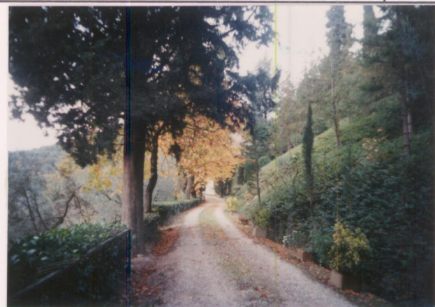
p.v. N. 2. Il viale d'ingresso