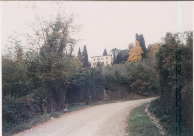
p.v. N. 1. Villa Romana dalla strada di S. Cornelio