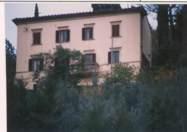
p.v. N. 3. Fronte principale