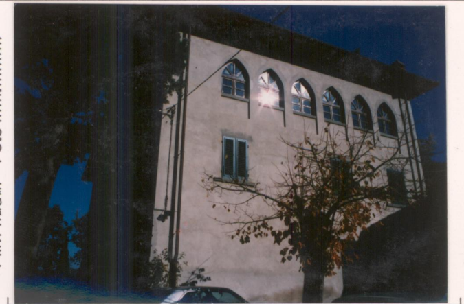
Film .669.. Foto 24.....