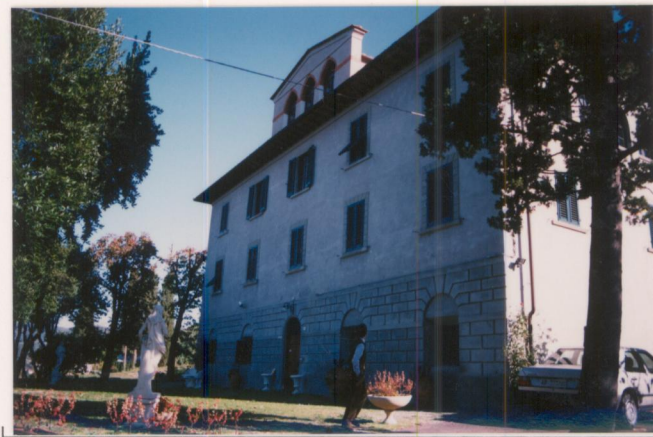
Film .669.. Foto 23.....