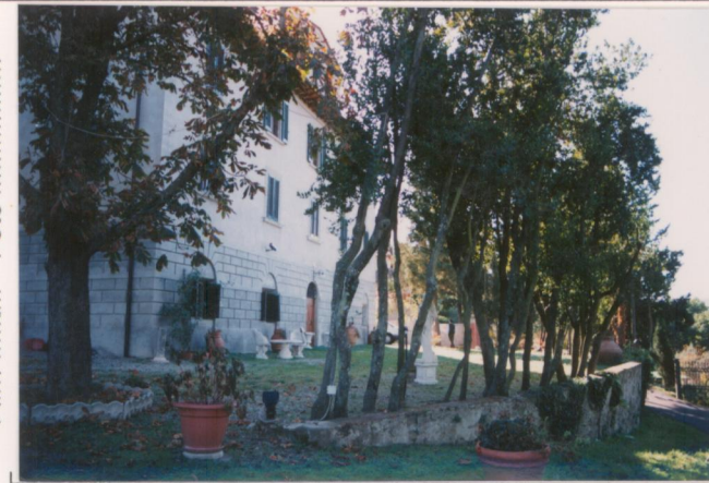
Film .669.. Foto 25.....