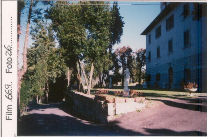
Film .669.. Foto 26.....