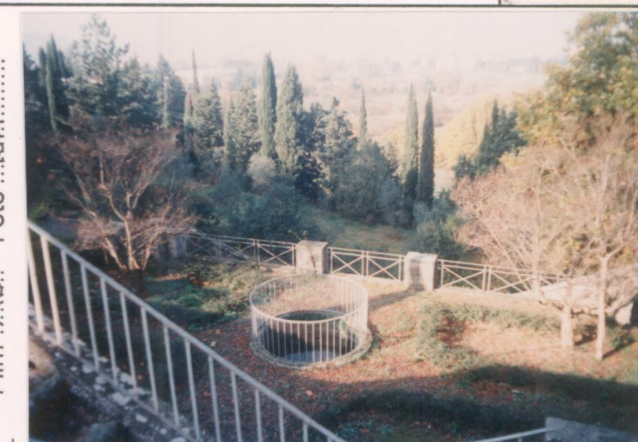
Film 713. Foto 16A.....