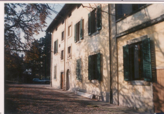
Film 713. Foto 15A.....