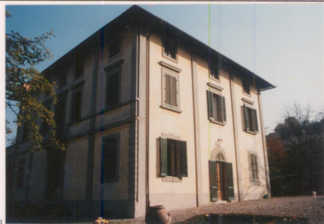
Film 713. Foto 17A.....