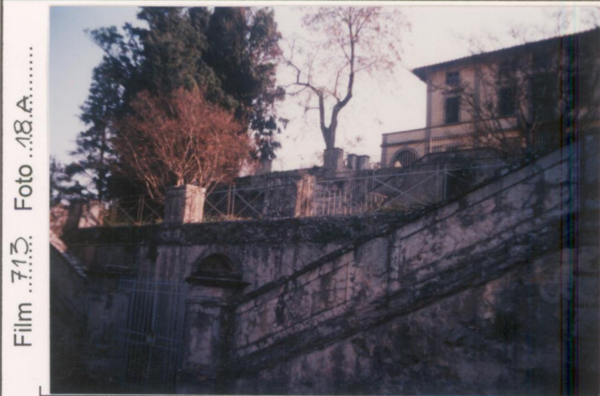
Film 713. Foto 18A.....