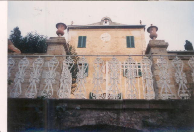
p.v. N. 4. Particolare del fronte principale