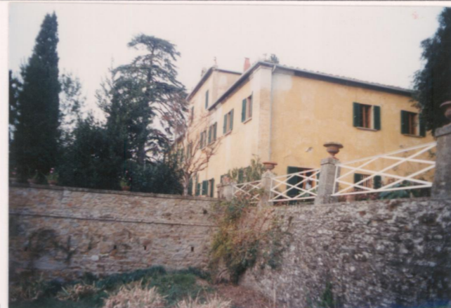
p.v. N. 3.