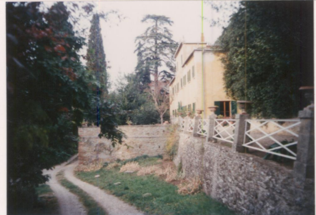
p.v. N. 2. veduta d'insieme