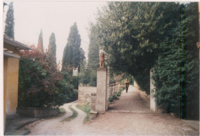
p.v. N. 1. Il viale d'ingresso