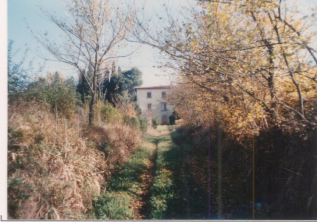
Film 7.13. Foto 34A.....