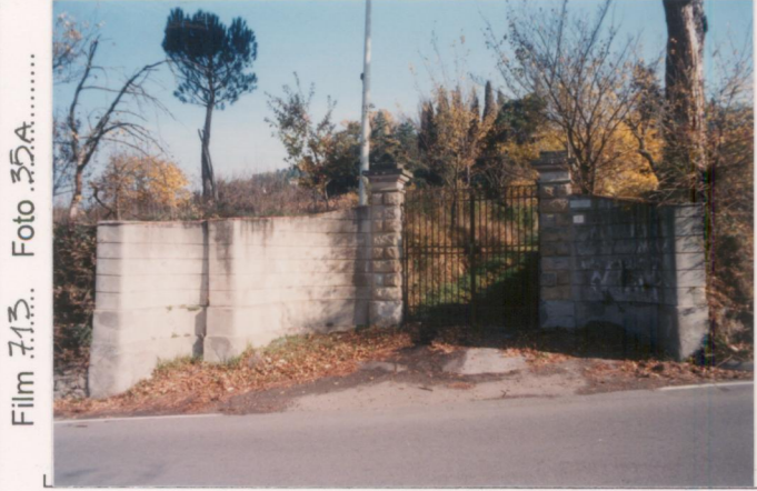
Film 7.13. Foto 35A.....