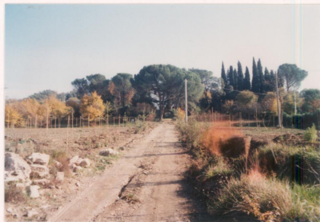
p.v. N. 1. Il viale d'ingresso.....