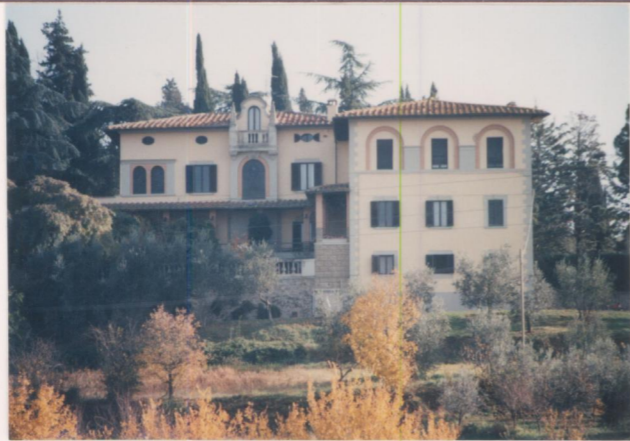
p.v. N. 2. Fronte principale