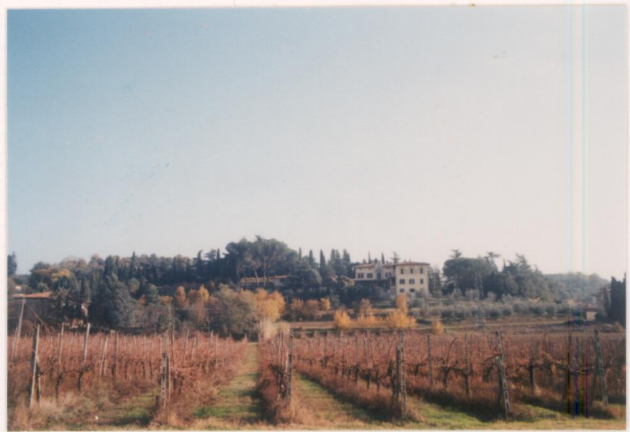
p.v. N. 1. Villa Wanda e il contesto paesaggistico