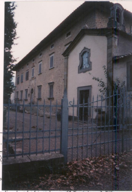
p.v. N. 1