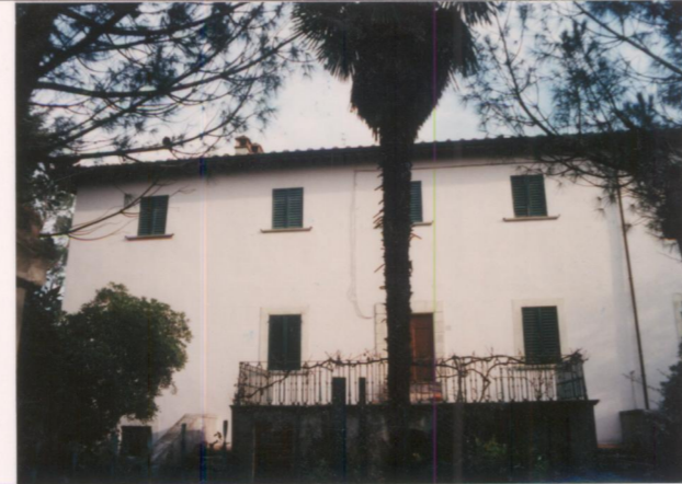
Film 665 bis Foto ...13.....