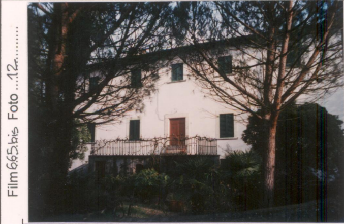
Film 665 bis Foto ...12.....