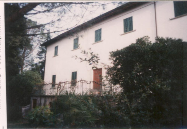
Film 665 bis Foto ...14.....