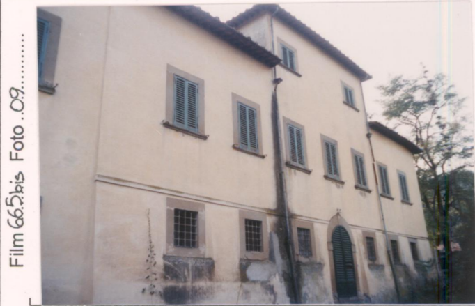
Film 665 bis Foto .09..... p.v. N. 1..... Fronte principale.....