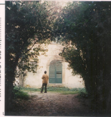
Film 665 bis Foto .11..... p.v. N. 3..... Il viale di accesso.....