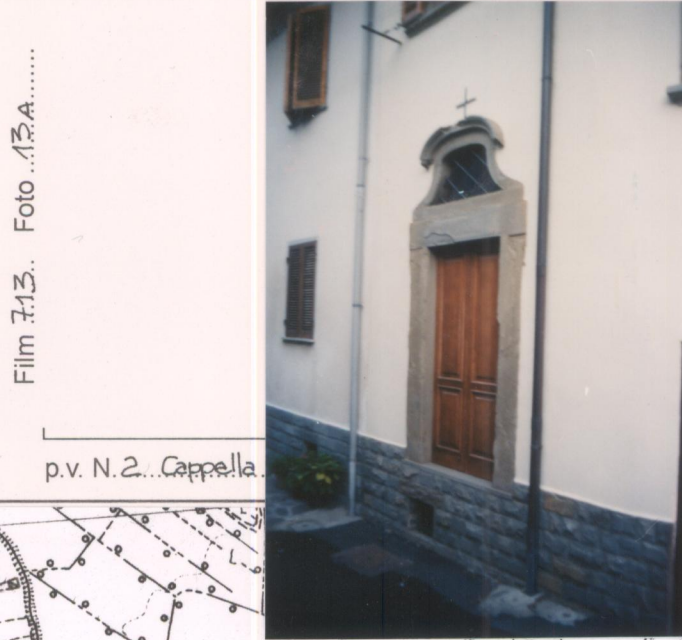
p.v. N. 2. Cappella