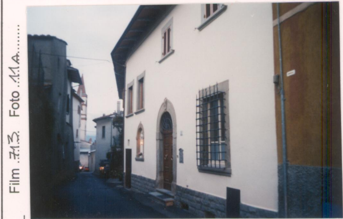
p.v. N. 1. Fronte principale