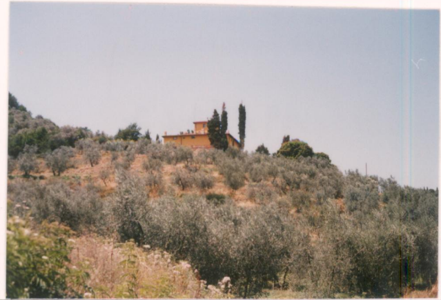
p.v. N. 1. veduta dell'intorno.....