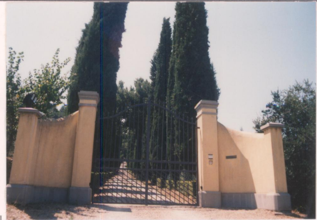
p.v. N. 2. il cancello d'ingresso.....