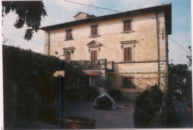
p.v. N. 2..... Fronte principale.....