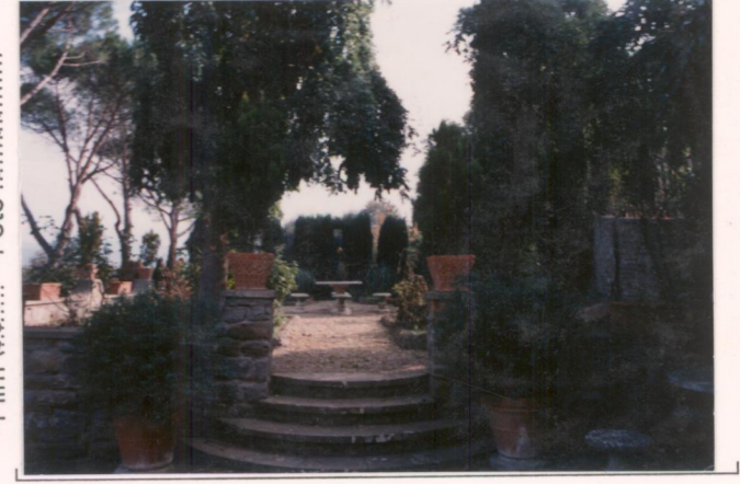
p.v. N. 4..... veduta del giardino verso il "roccolo".....