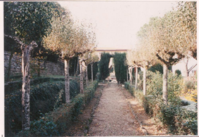
p.v. N. 3..... Il viale to alberato del giardino retrostante.....