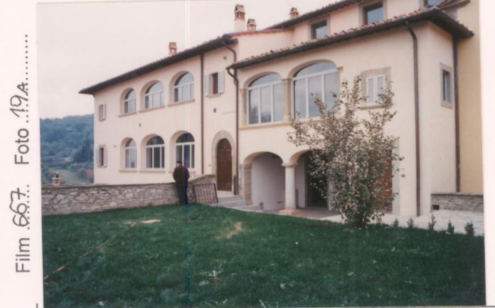
Film 667... Foto 19A..... p.v. N. 2... veduta del loggiato.....