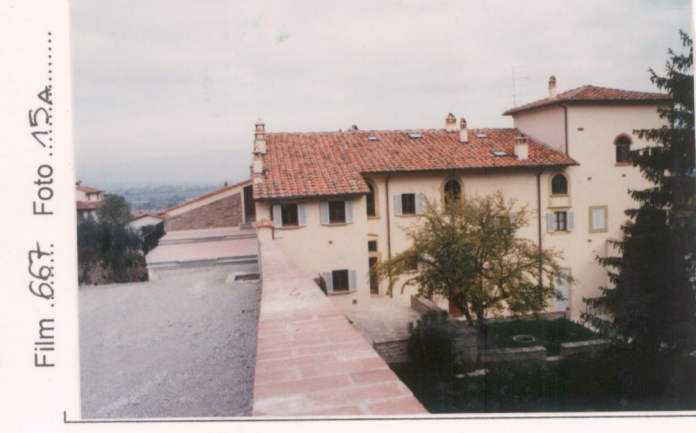
Film 667... Foto 15A..... p.v. N. 4... Il giardino sul retro.....