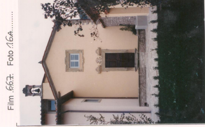
Film 667... Foto 16A..... p.v. N. 3... La cappella.....