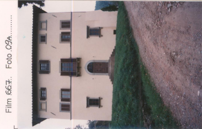
Film 667... Foto 09A.....