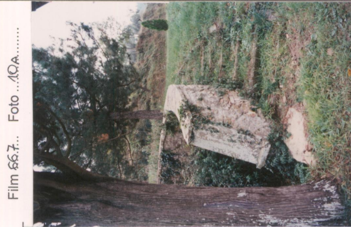
Film 667... Foto 10A.....