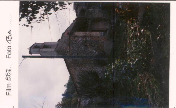
Film 667... Foto 13A.....