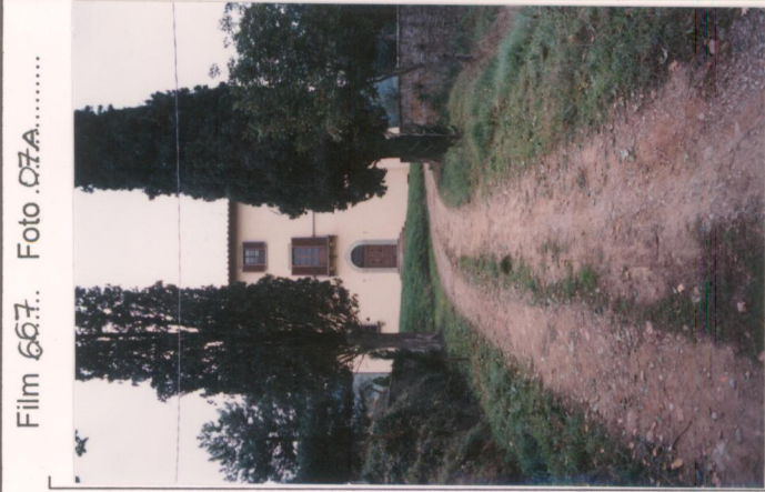
Film 667... Foto 07A.....