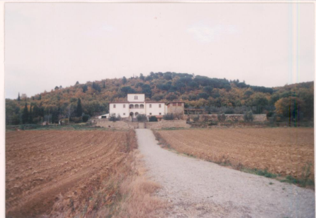
p.v. N. 1. Podere La Vallina