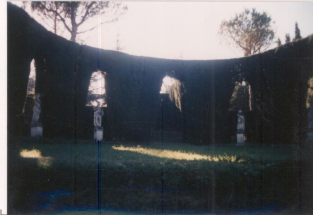
p.v. N. 6: scena del teatrino di verzuva.....