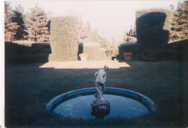
Film 663. Foto 5