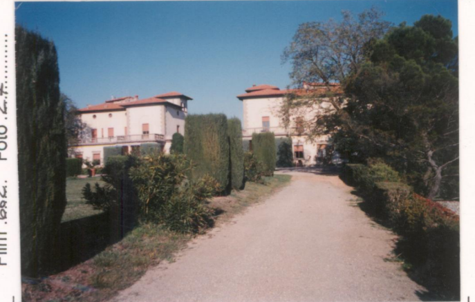
Film 662. Foto 27