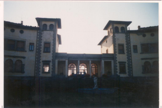
p.v. N. 12