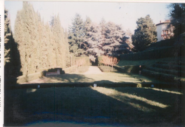
p.v. N. 7 dalla "scena".....