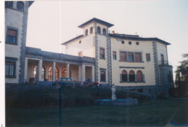
Film 663. Foto 4