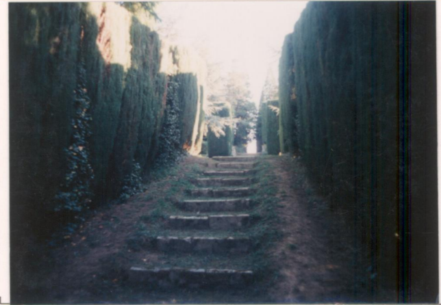
p.v. N. 9