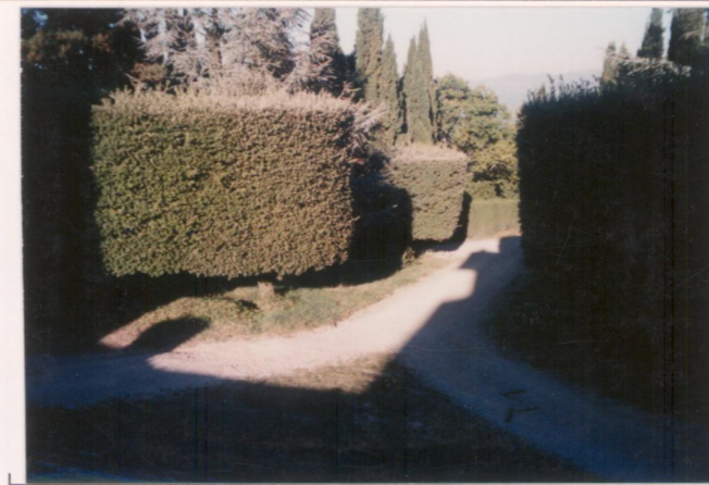
p.v. N. 11