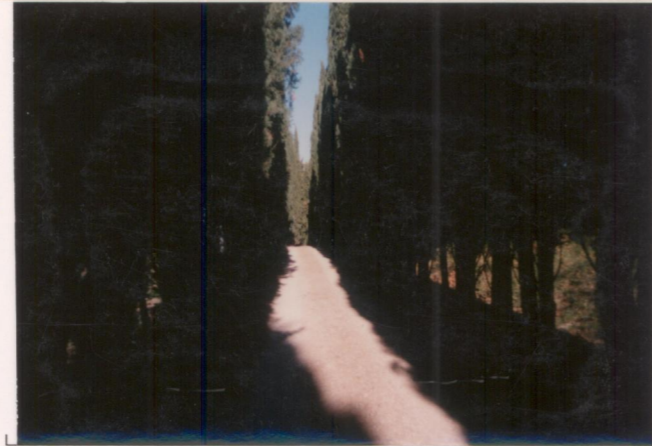
p.v. N. 10: viale alberato di bordo