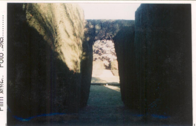
p.v. N. 8.....