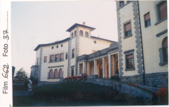
Film 662. Foto 37