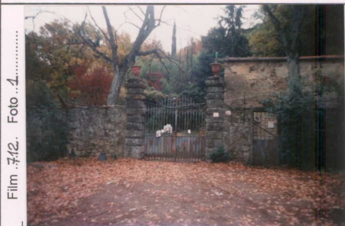
Film 712. Foto 1