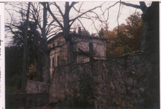
Film 712. Foto 4