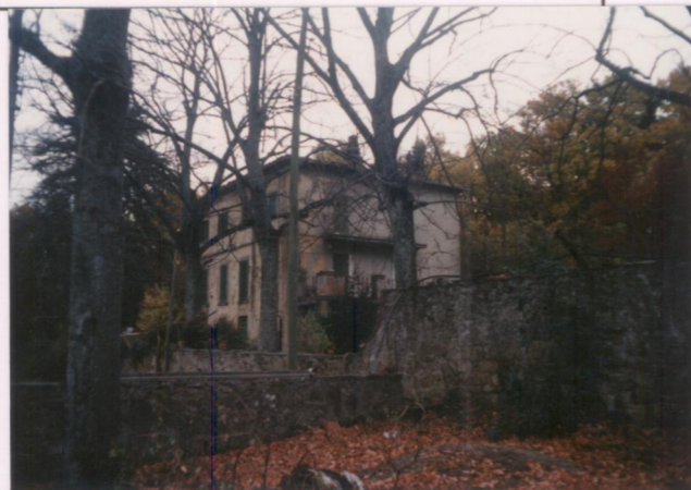
Film 712. Foto 2