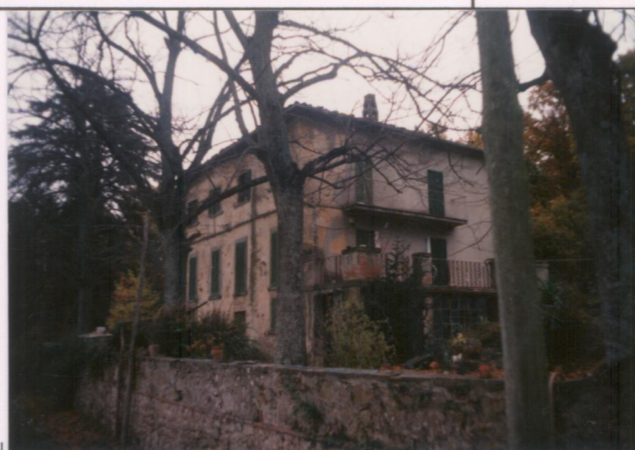
Film 712. Foto 3