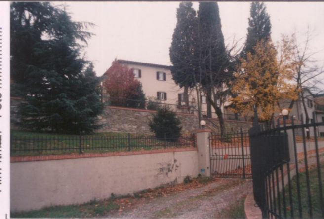
Film 712. Foto 7.