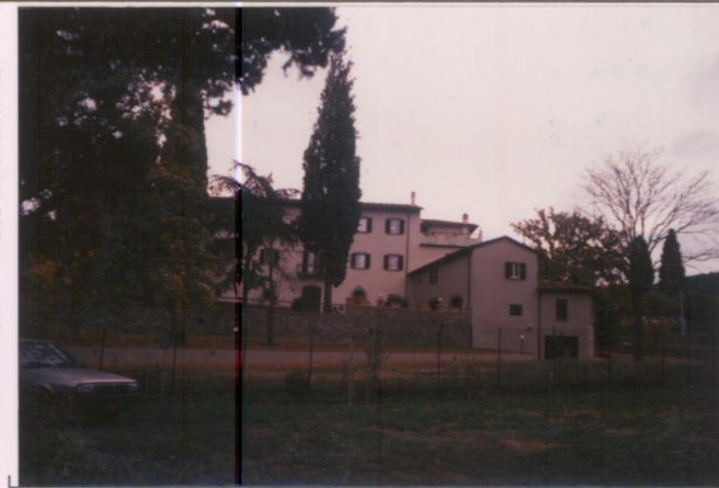
Film 712. Foto 6.