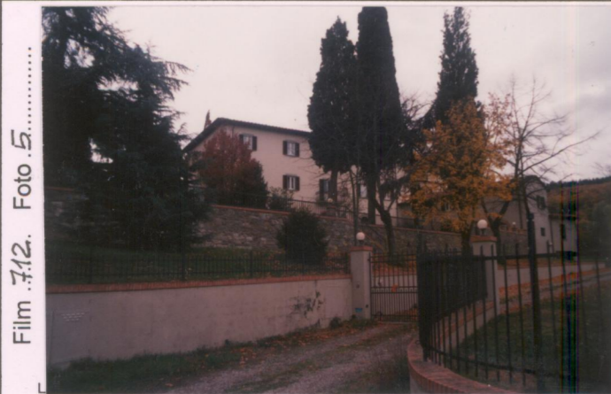
Film 712. Foto 5.